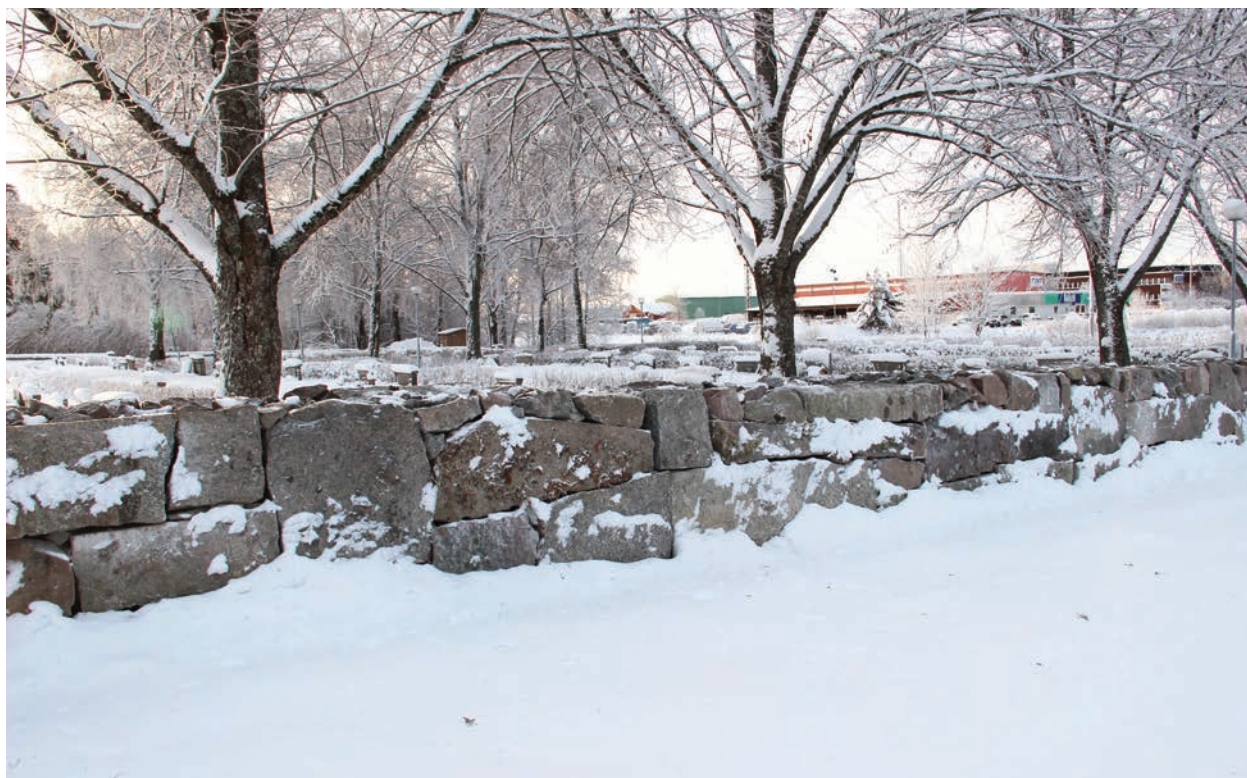
Figur 11. Muren efter omläggning, foto från norr (Norrby kyrkogårdsmur_060).