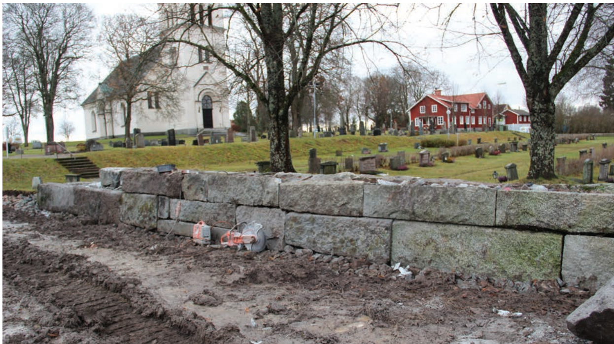
Figur 8. Muren under omläggning, foto från nordväst. Partiet gjordes om eftersom muren byggts upp av annan sten än de som tidigare ingick i muren och därmed fick ett annat utseende (Norrby kyrkogårdsmur_027).