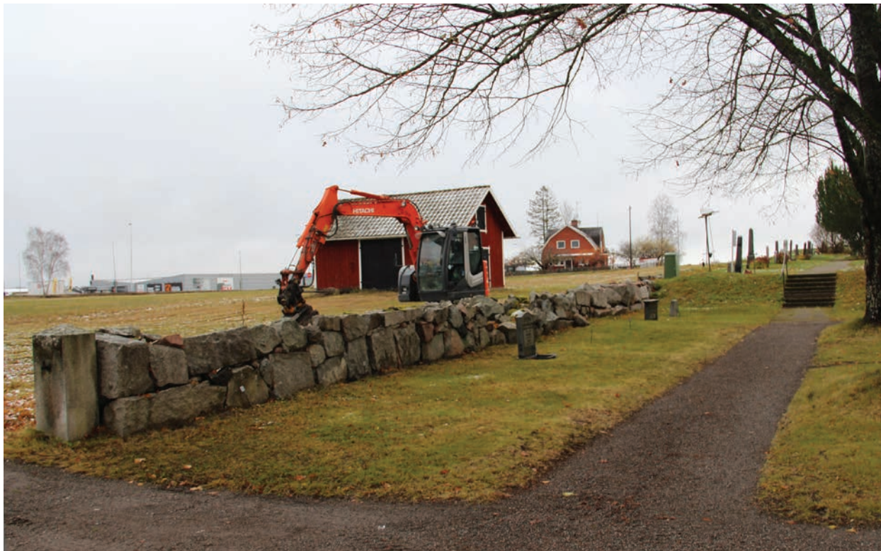
Figur 3. Muren innan omläggning, foto från väster (Norrby kyrkogårdsmur_023).