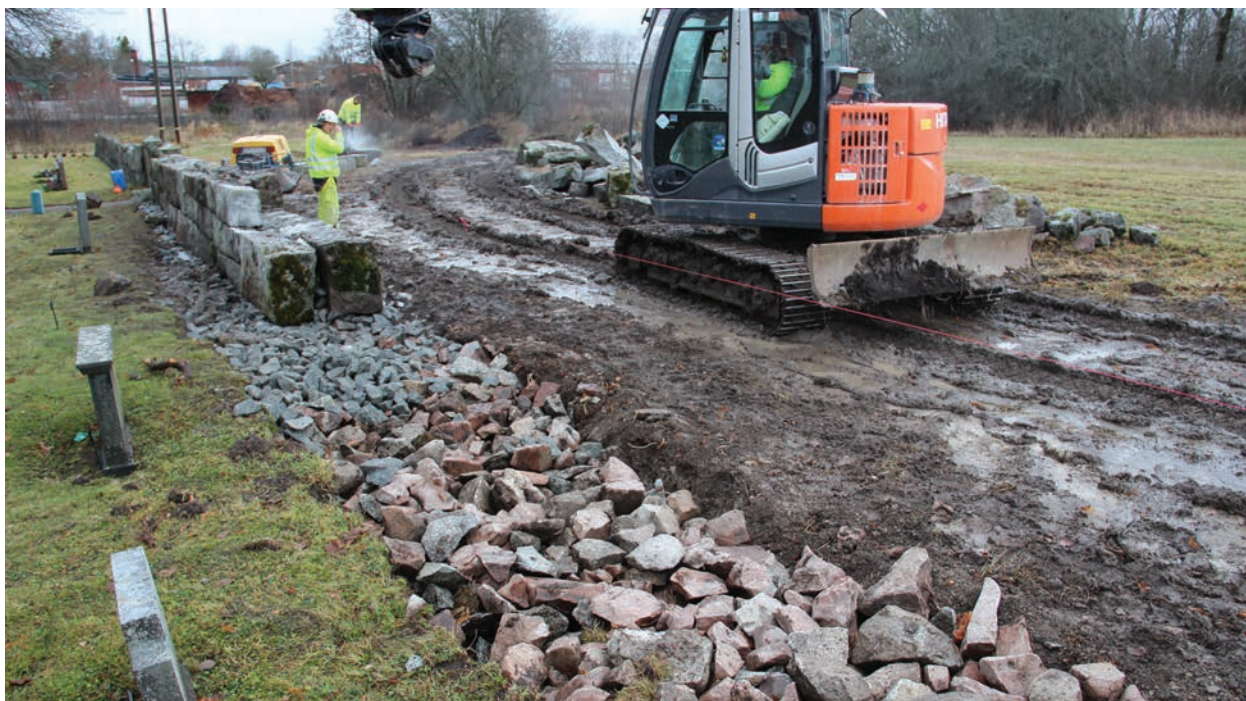
Figur 9. I bild syns grundläggningen med krossten, foto från öster (Norrby kyrkogårdsmur_025).