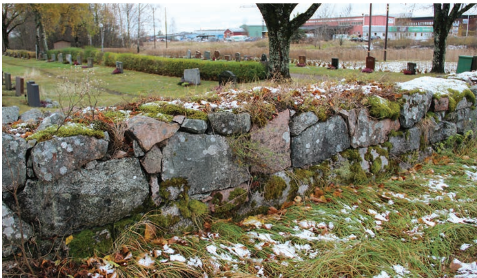
Figur 7. Murparti väster om aktuell mur för omläggning, foto från norr. Muren skulle tjäna som förlaga vid omläggningen (Norrby kyrkogårdsmur_022).