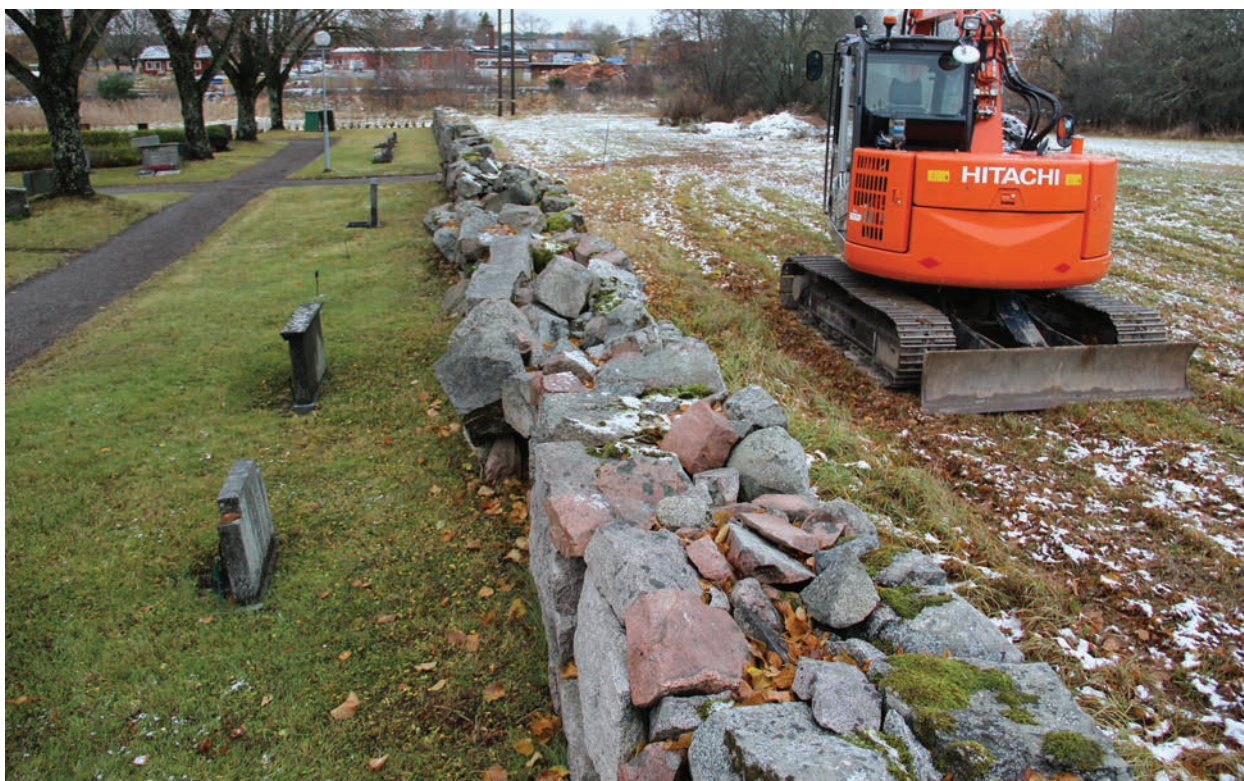
Figur 4. Muren innan omläggning, foto från öster (Norrby kyrkogårdsmur_009).