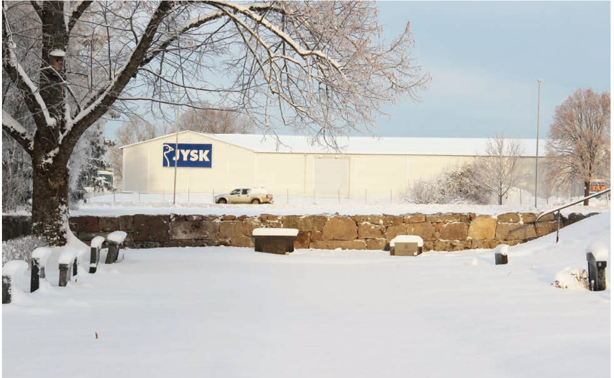
Figur 12. Muren efter omläggning, foto från söder (Norrby kyrkogårdsmur_072).