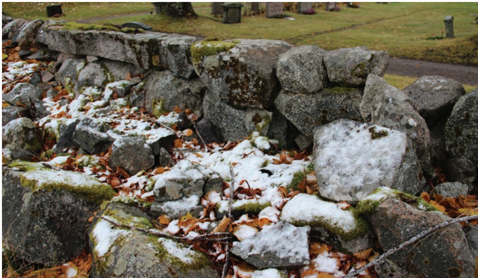
Figur 6. Muren innan åtgärd, foto från nordväst. Den yttre murverket och den mindre stenen i utrymmet mellan murverken har fallit ut (Norrby kyrkogårdsmur_005).