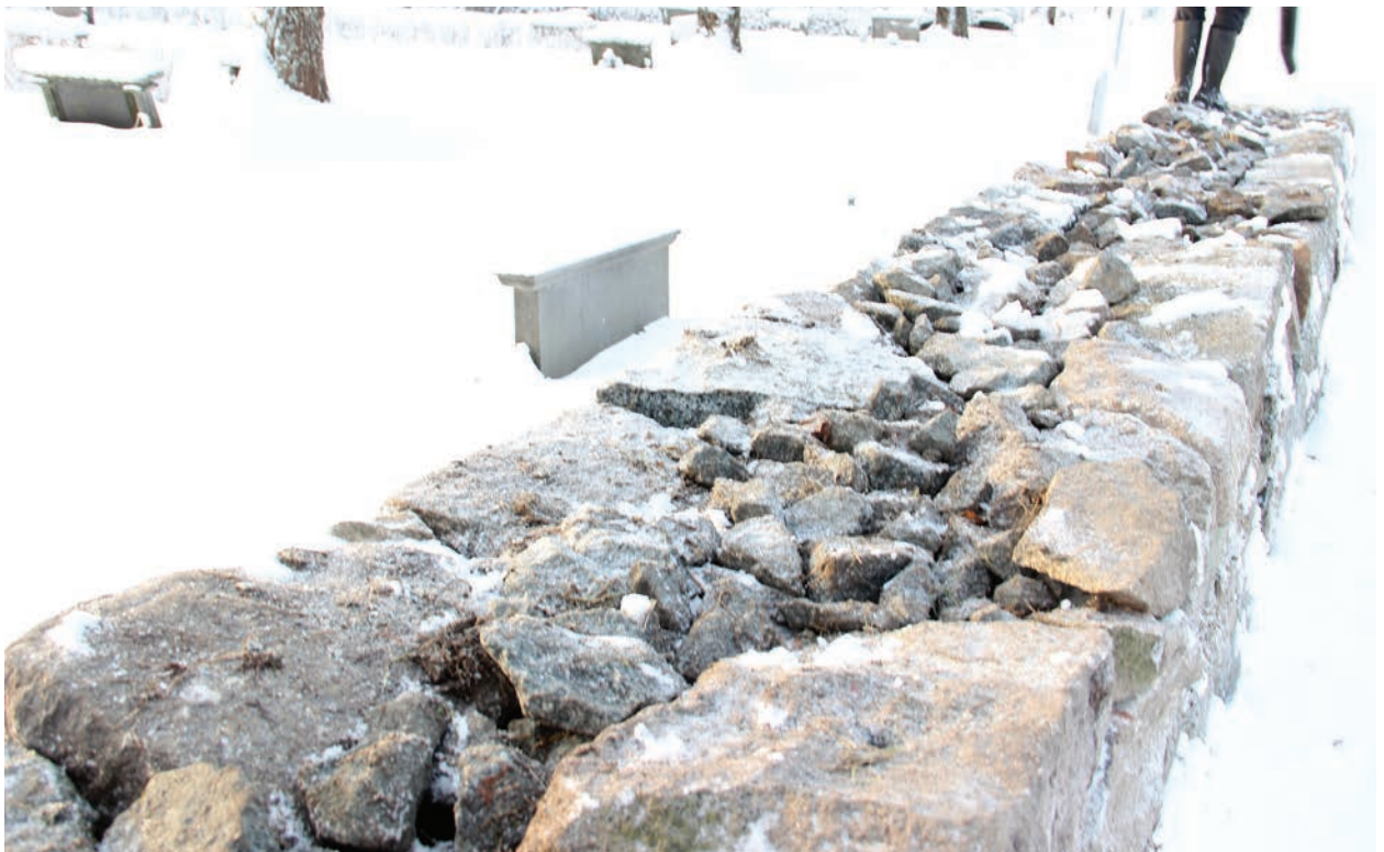
Figur 13. Murens yttre och inre murverk samt fyllnadssten i mindre storlek, foto från nordost (Norrby kyrkogårdsmur_055).