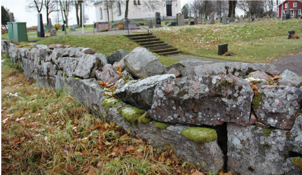
Figur 5. Muren innan åtgärd, foto från nordväst (Norrby kyrkogårdsmur_007).