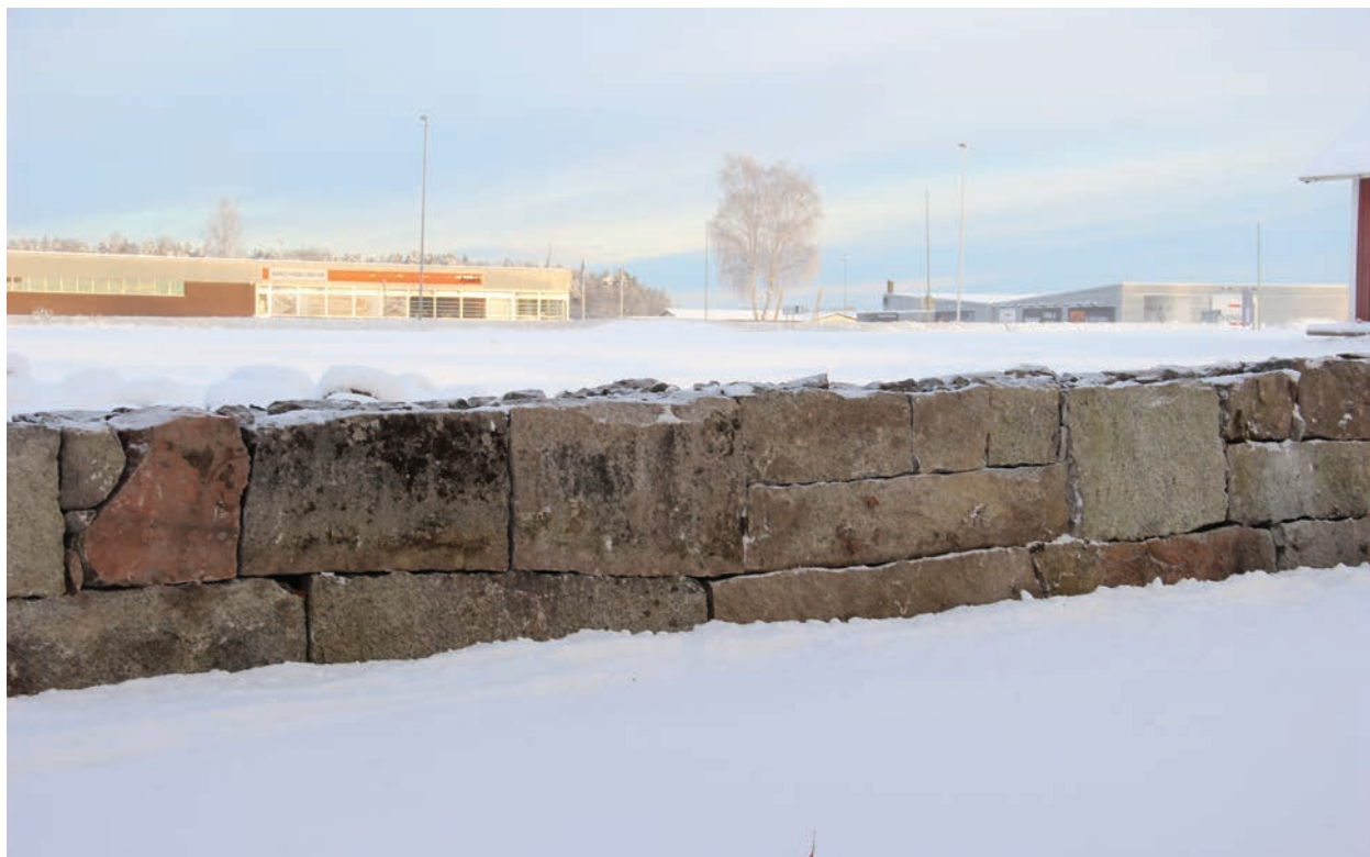
Figur 10. Muren efter omläggning, foto från söder (Norrby kyrkogårdsmur_066).