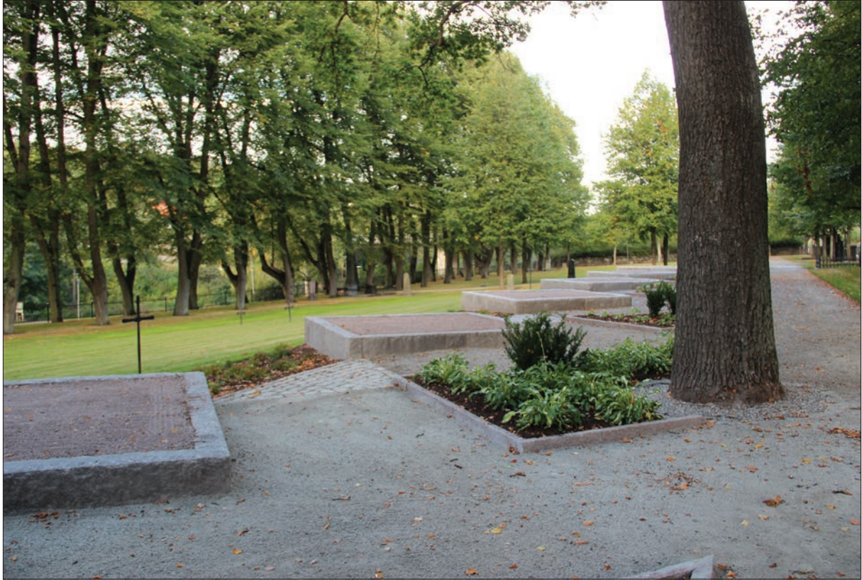
Figur 15. Området sett från söder.