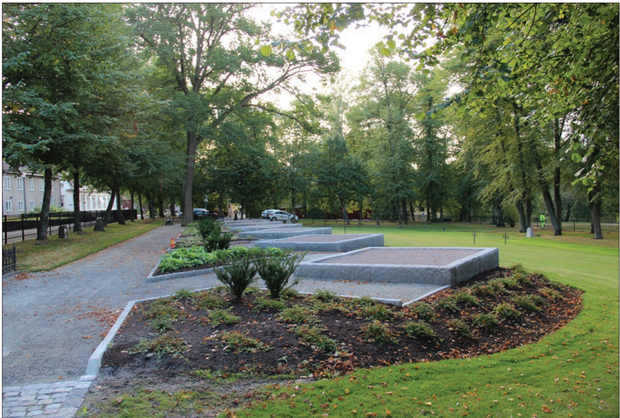
Figur 16. Området sett från norr.