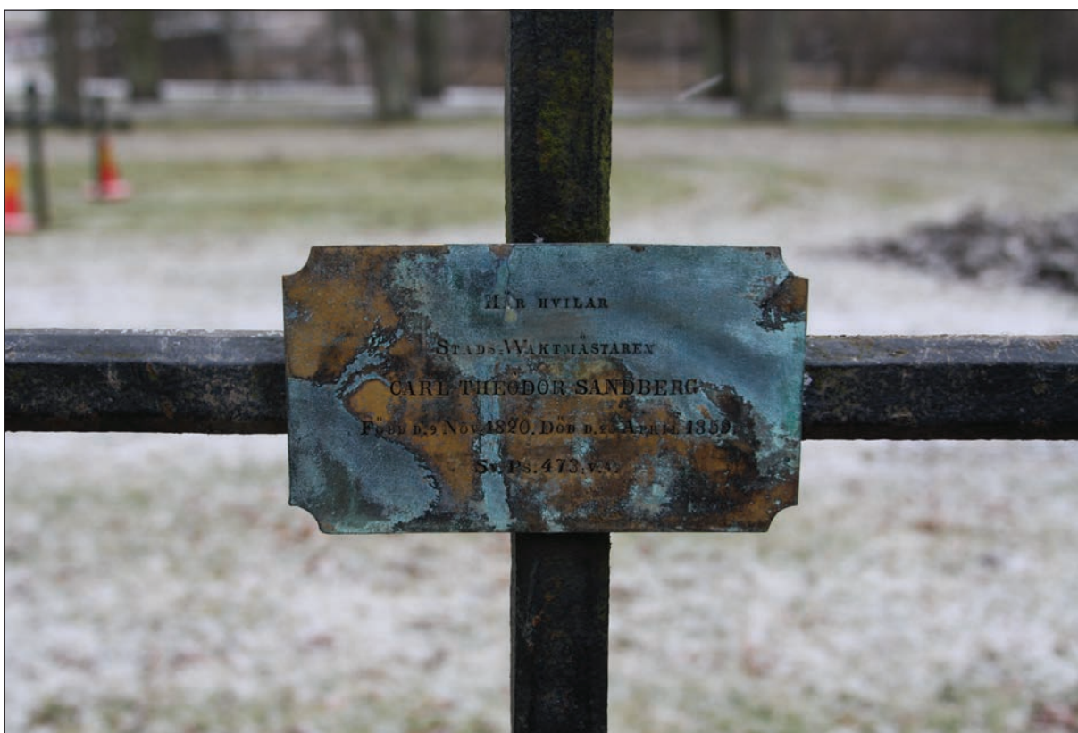
Figur 8. "Här hvilar Stads Waktmästaren Carl Theodor Sandberg. Född d. 9 nov 1820. Död d. 20 April 1859. Sv. Ps. 473: v 4".