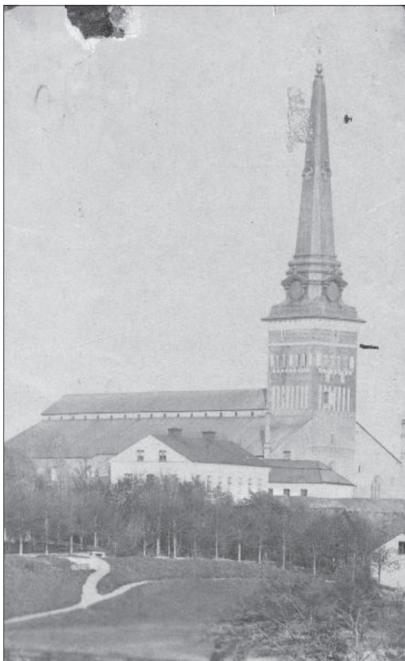
Figur 4. Västerås domkyrka fotograferad vid 1800-talets slut. I bildens främre del anas även Björlingska kyrkogården.