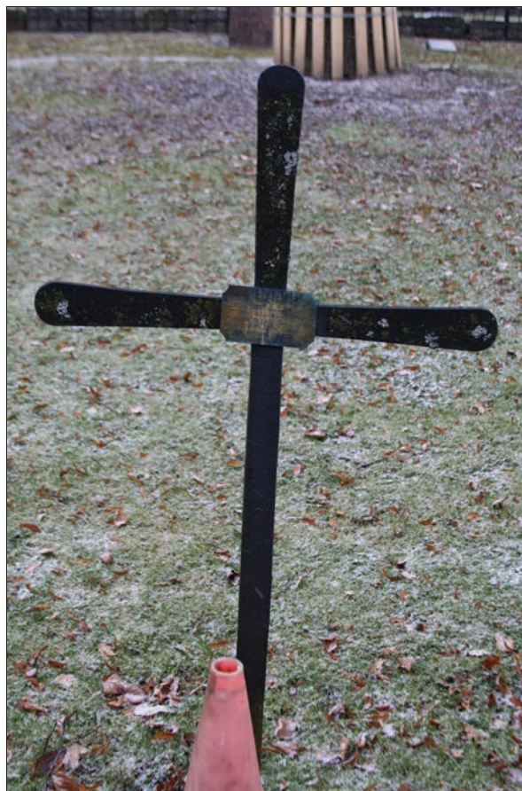
Figur 7. Det sydliga av de smideskors som står i anslutning till det aktuella området. Plaketten vetter mot väster, ketten vetter mot öster.