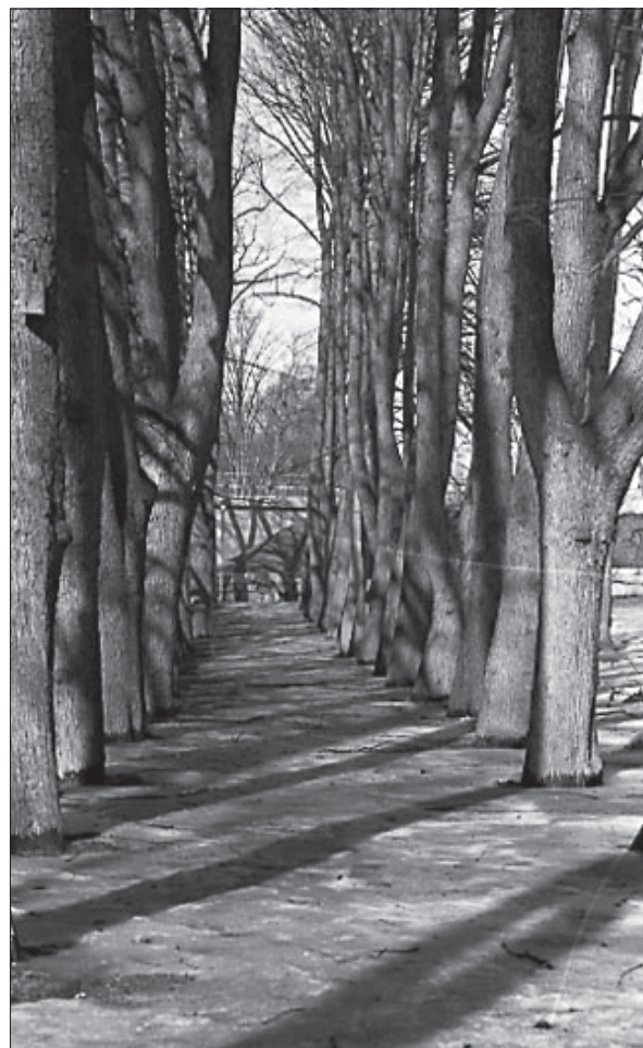
Figur 5. Allén på kyrkogårdens västra sida. Foto Västmanlands läns museums arkiv.