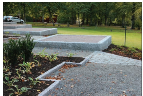
Figur 14. Stenramarna är högre mot väster än mot öster. Planteringarna kringgärdas av kantstenar av granit.