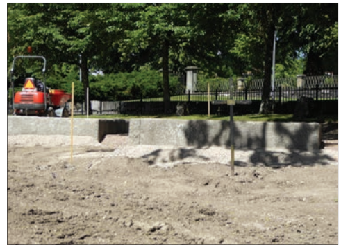
Figur 11–12. Arbetet med att sätta ut stenramarna har påbörjats.