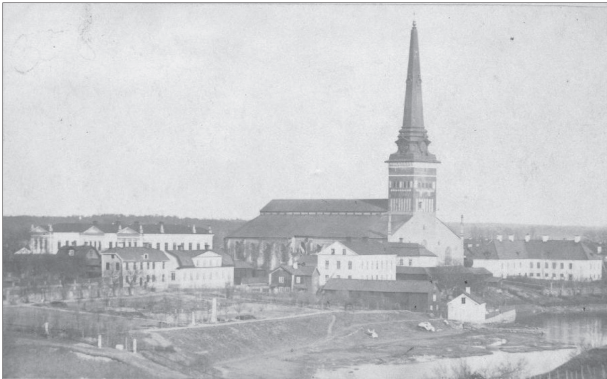
Figur 3. Björlingska kyrkogården på ett foto från sent 1800-tal.