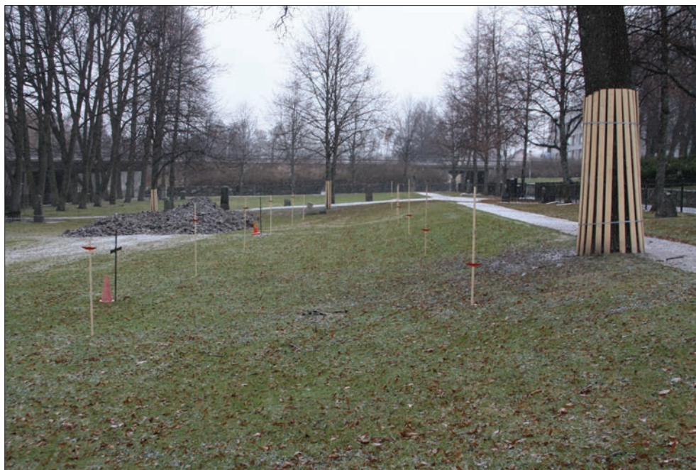
Figur 9. Det planerade området på kyrkogården sett från söder. De röda markeringarna på käpparna markerar höjden på granitomfattningens ovankant. Trumslagareken skyddad med inbrädning.

Ett problem var de två smidda järnkors som står väster om det planerade partiet. Dessa har efter anläggandet av stenramarna hamnat i den nyanlagda slänten mot väster. För att undvika att de skulle stå för djupt lyftes de upp något. De står dock kvar på samma plats. Korsen tillhör personer som avlidit vid 1800-talets mitt och är alltså relativt gamla. De står i linje men vetter åt varsitt håll, osäkert om de står på ursprunglig plats.