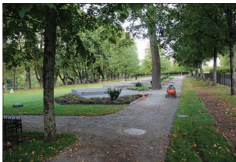
Figur 13. Den återställda gångvägen ansluter materialmässigt mot de nyanlagda gravplatserna.