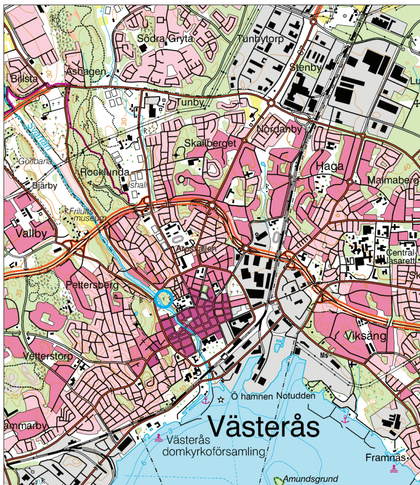
Figur 1. Kyrkogårdens läge markerat med en blå ring. Utdrag ur Gröna kartan. Skala 1:50 000.