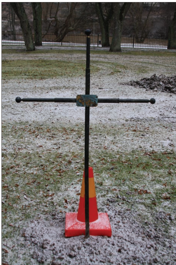
Figur 6. Det nordliga av de smideskors som står i anslutning till det aktuella området. Plaketten vetter mot öster.