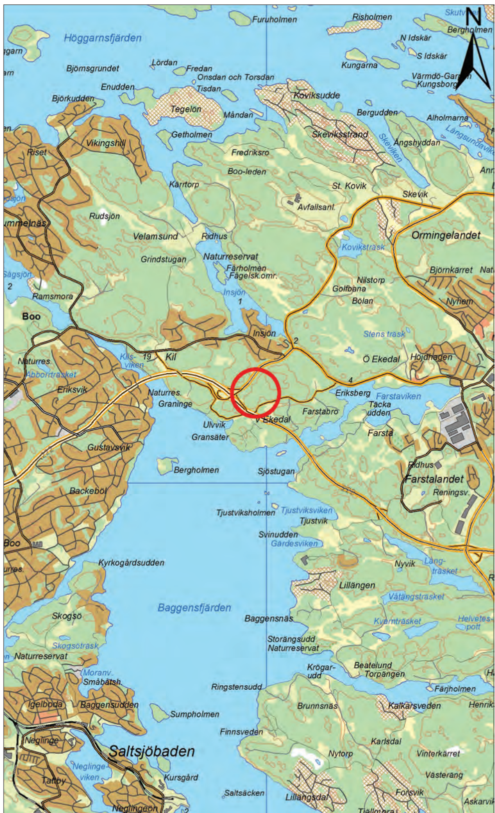
Figur 1. Utredningsområdets läge markerat med en röd ring. Utdrag ur digitala Terrängkartan. Skala 1:50 000.