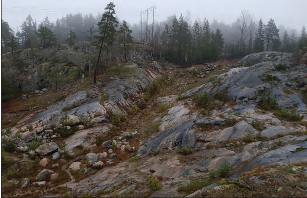
Figur 6. I den nordöstra delen av utredningsområdet var sanden i sprickdalarna bortgrävd. Under klungan av granar (strax utanför utredningsområdet) ligger den kvar. Inga spår av förhistoriska aktiviteter kunde identifieras i kanten av det sandiga området. Foto från sydväst.