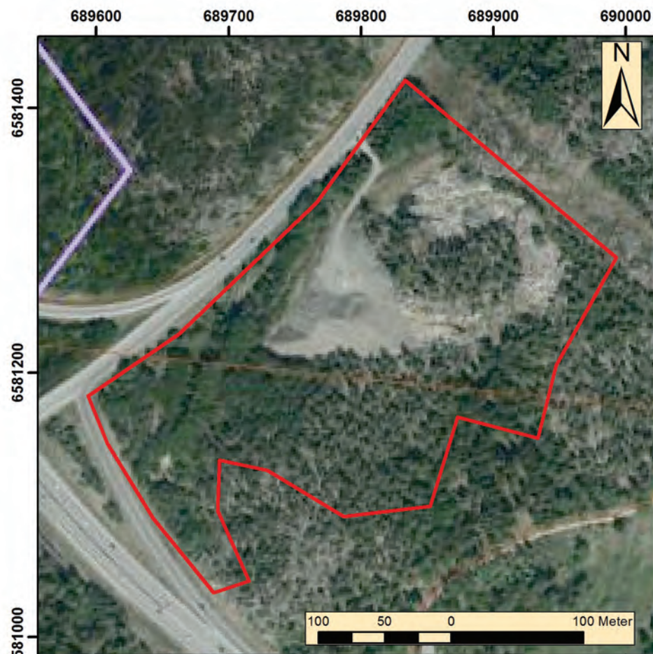
Figur 3. Utredningsområdet markerat med rött på ortofoto från FMIS. Det ljusa, rundade partiet inom utredningsområdet är bergtäktverksamheten som är undantagen i den arkeologiska utredningen. Skala 1: 4 000.