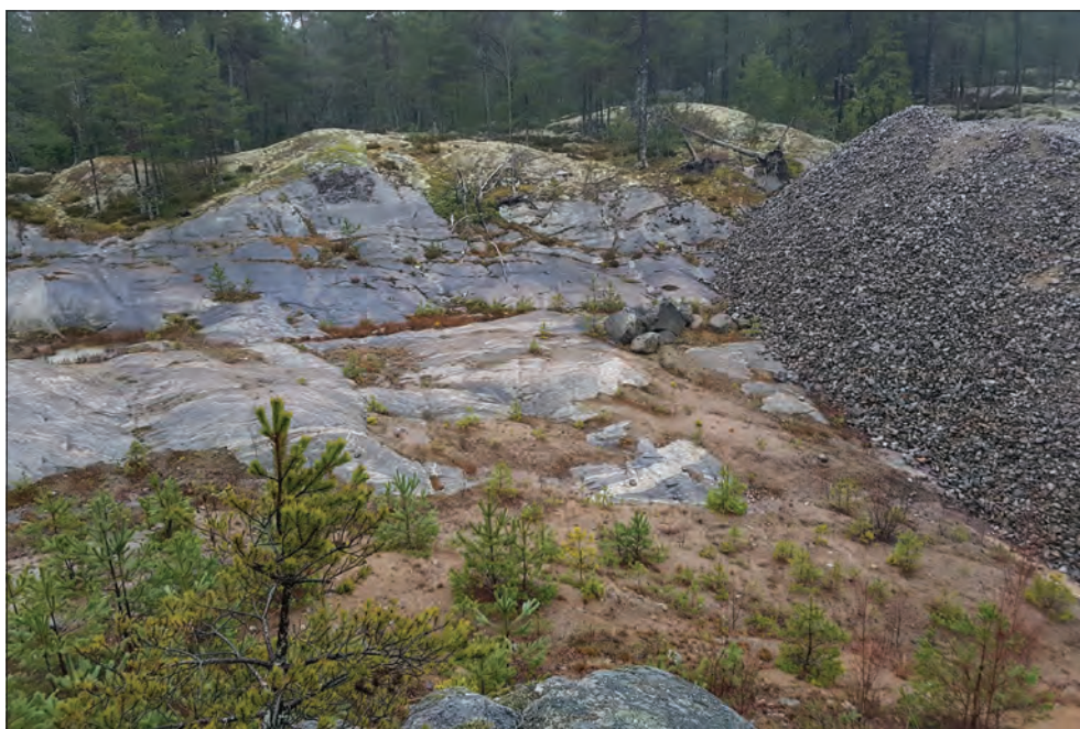
Figur 5. De övre metrarna av den sand som en gång har legat mellan bergshöjderna är nu bortgrävd. Det är endast i skrevorna som den finns kvar. Högen med stenkruss till höger i bild utgör en del av bergtäktverksamheten.

Vid fältinventeringen kunde det konstateras att större ytor än vad som syntes på kartor och flygbilder var påverkade av sentida aktiviteter. I den sydvästra delen, längs med motorvägen, och hela delen som vetter mot Skärgårdsvägen (åt nordväst) var marken påverkad i och med vägbyggena. Längs utredningsområdets nordöstra gräns var det påverkat av bergtäktverksamheten.