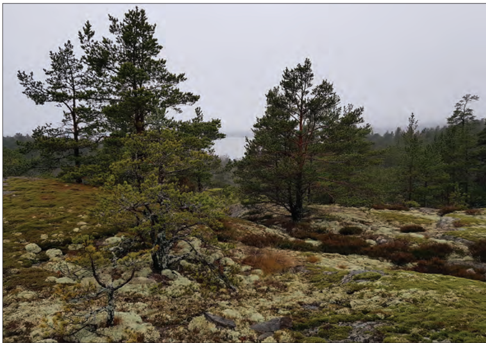
Figur 4. Den sydvästra delen av utredningsområdet med Baggenfjärden i bakgrunden.

Topografin inom utredningsområdet är kuperad, höglänt och bergig. Undergrunden består till övervägande del av urberg med begränsade partier med tunna moränlager och partier med glacial lera. Området är bevuxet med skog, förutom de delar som utgör bergtäktverksamheten och längs den nordöstra delen som är avverkad då det löper en kraftledningsgata där. Höjden över havet varierar från knappa 25 till dryga 45 meter.