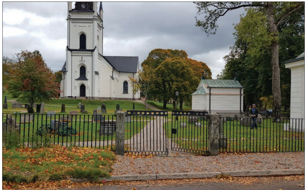
Figur 16. Nytt grus i likbet med befintligt grus på kyrkans grusgångar. Gruset fick specialbeställas från Kungsör.

Vid Ohlssons gravkor ligger stora stenhällar jämt fördelade intill varandra. Dessa visade sig vara grovhuggna på undersidan (cirka 30 cm tjocka) vilket försvårade omläggningen och man beslutade att endast rengöra stenarna med högtryckstvätt.