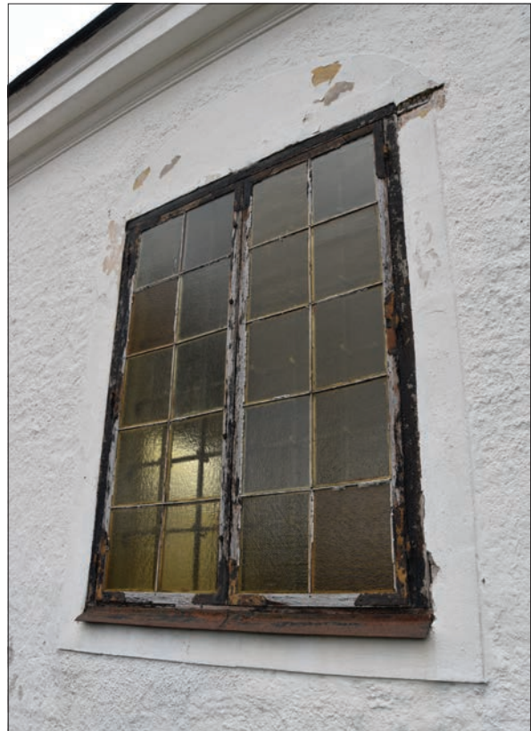
Figur 7. Fönster på västra sidan, Hisings-Heikenskiölds gravkor. Gravkoret har tre rektangulära fönster med enkelbågar av trä i två lugter med tio glas i varje ruta. Bågarna har gångjärn av mycket hög ålder.