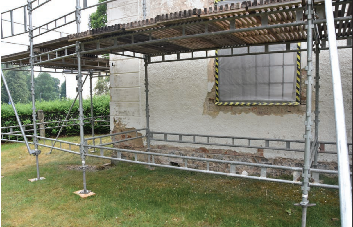
Figur 12. Hisings-Heikenskiölds gravkor, östra fasaden. Fönstren har plockats ur och fasden tvättats.