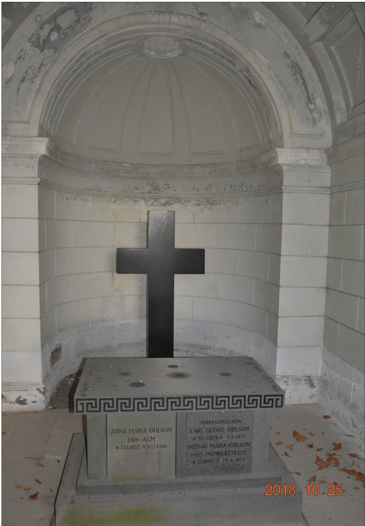
Figur 35. Detalj av kors och altare, Ohlssons gravkor.