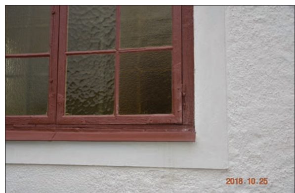
Figur 32. Detalj av fönster, Hisings-Heikenskiölds gravkor.