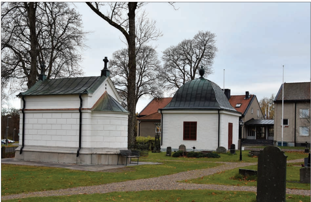
Figur 20. De nyrenoverade gravkoren sedda från kyrkogården.