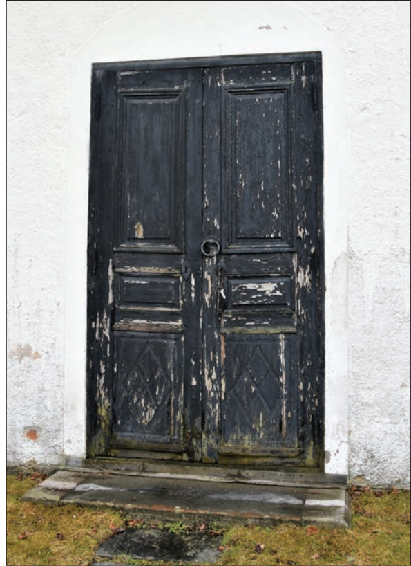
Figur 5. Entréddörr till Hisings-Heikenskiölds gravkor var målade i svart alkydfärg.