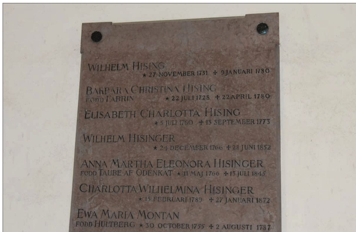
Figur 37. Inskriptionstavla på väggen i Hisings-Heikenskiölds gravkor.