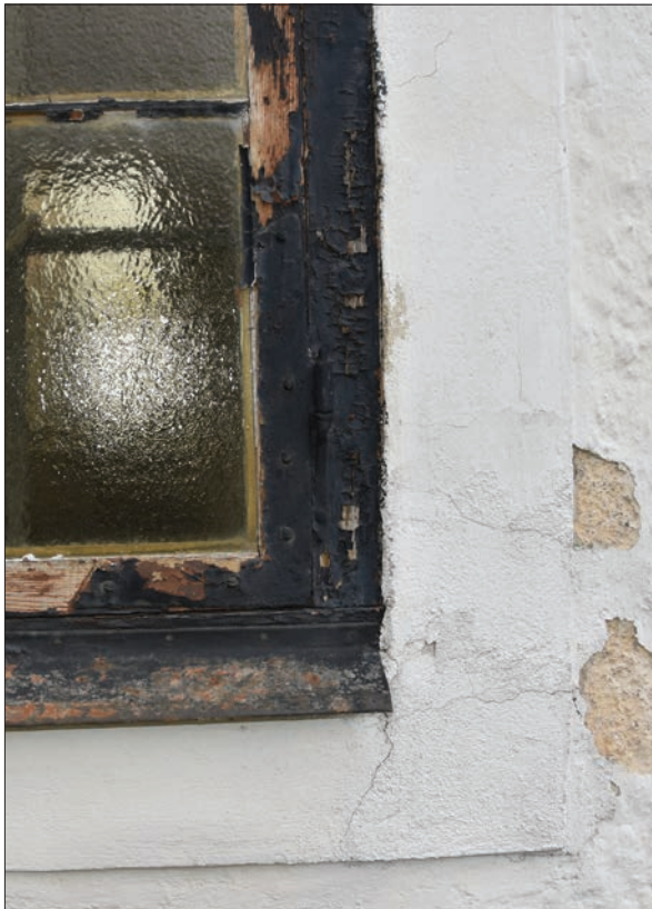
Figur 6. Detalj av fönster och fasad, Hisings-Heikenskiölds gravkor. Fönsterbläck var rostangripna och träskador fanns på karmar. Lägg märke till fasadens tidigare färgsättning som haft en gulare ton.