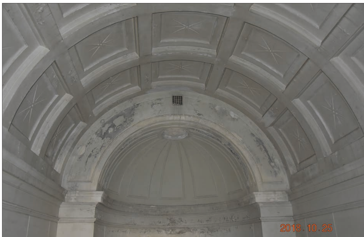
Figur 34. Detalj av taket, Ohlssons gravkor.