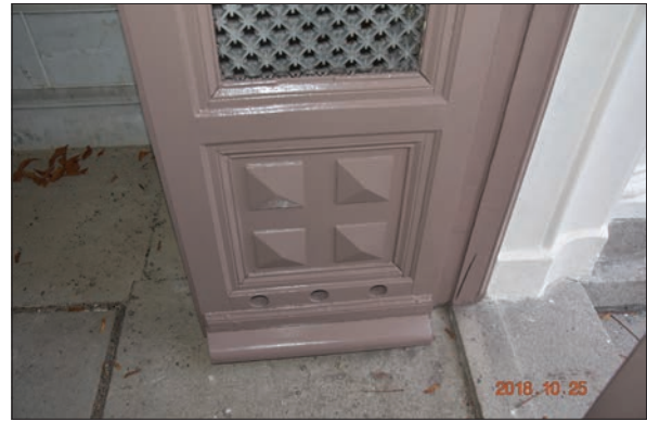
Figur 29. Detalj av nymålade dörr, Ohlssons gravkor.