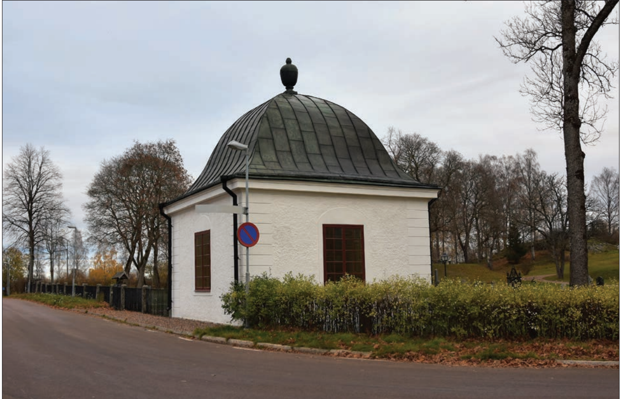
Figur 25. Hisings-Heikenskiölds gravkor, västra och södra fasaden.