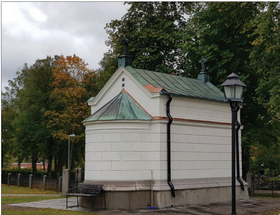
Figur 15. Ohlssons gravkor. Norra och västra fasaden.