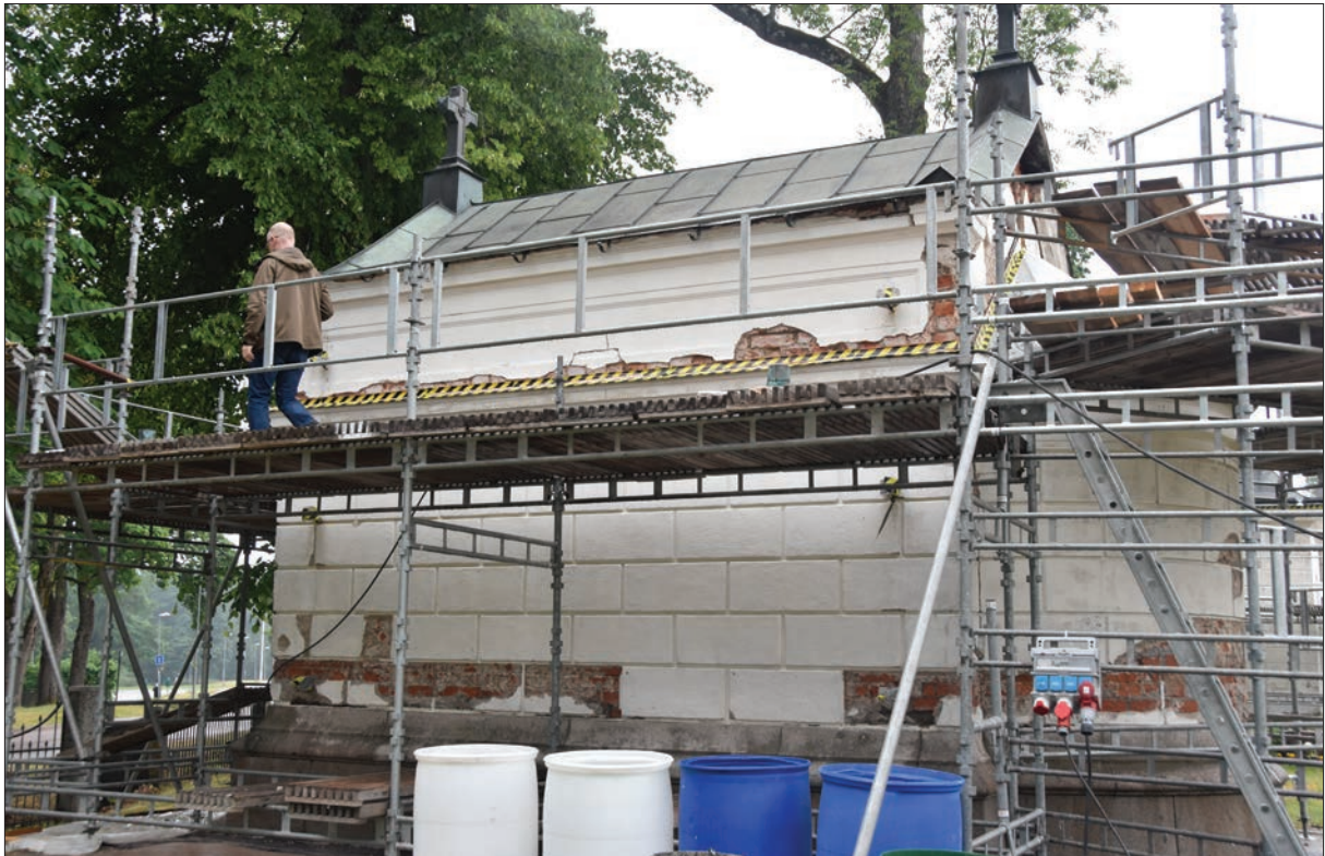
Figur 10. Avstämmingsmöte den 10 juni 2018. Ohlssons gravkor. Under maskeringstejpen sitter nymonterad gesims i kopparplåt.