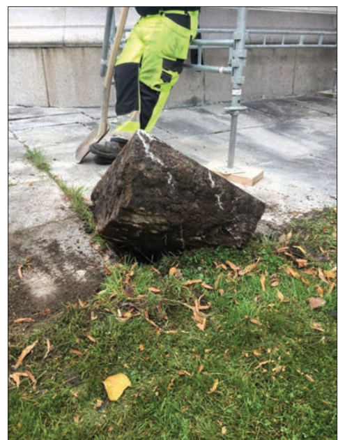
Figur 18. Tanken var att stenläggningen skulle läggas om, men detta visade sig vara en omöjlig uppgift.