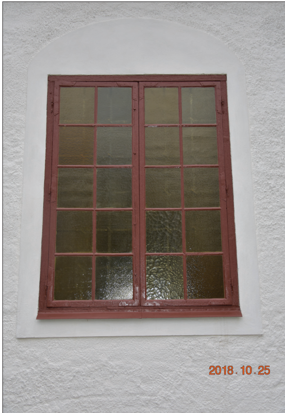
Figur 27. Fönster Hisings-Heikenskiölds gravkor, några rutor är ersatta. Dessa fick beställas från Tyskland.