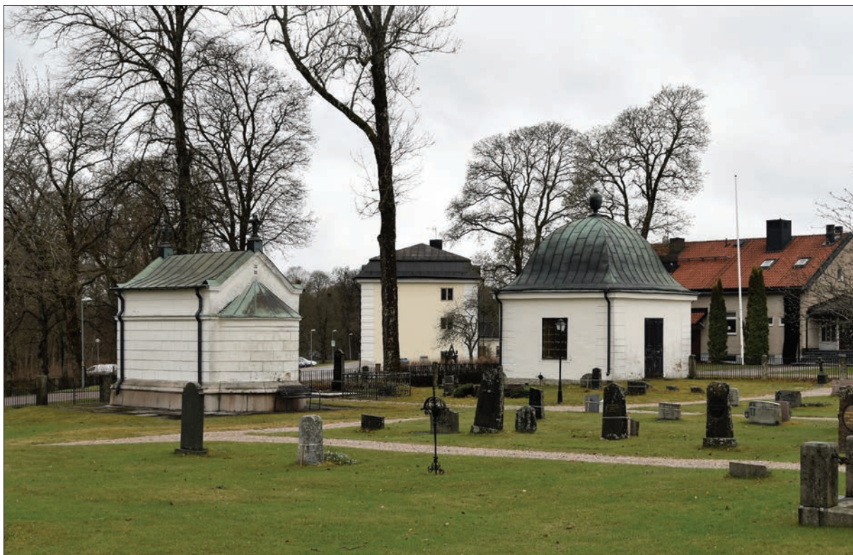
Figur 2. Startmöte den 3 maj 2018. Gravkoren sedda från kyrkogården. Ohlssons gravkor till vänster i bild.