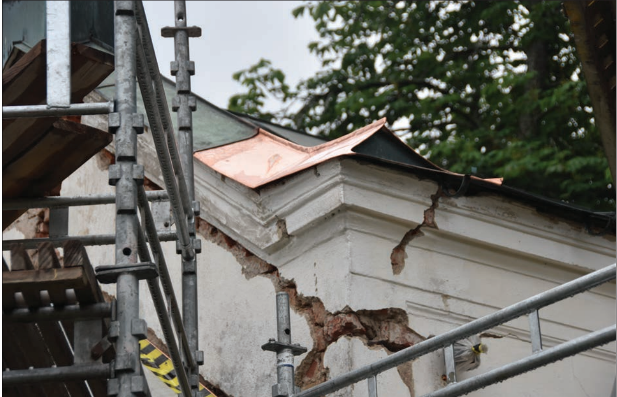
Figur 8. Detalj av plåtlagning med ny kopparplåt på Ohlssons gravkor. Takarbetena har utförts av Aros Plåt & Vent AB.