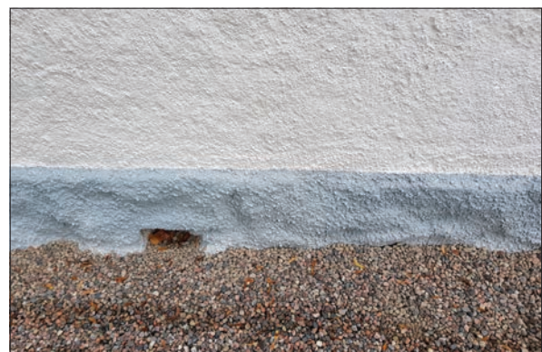
Figur 31. Nytt grus, sockel och fasad. Hisings-Heikenskiölds gravkor, östra sidan.