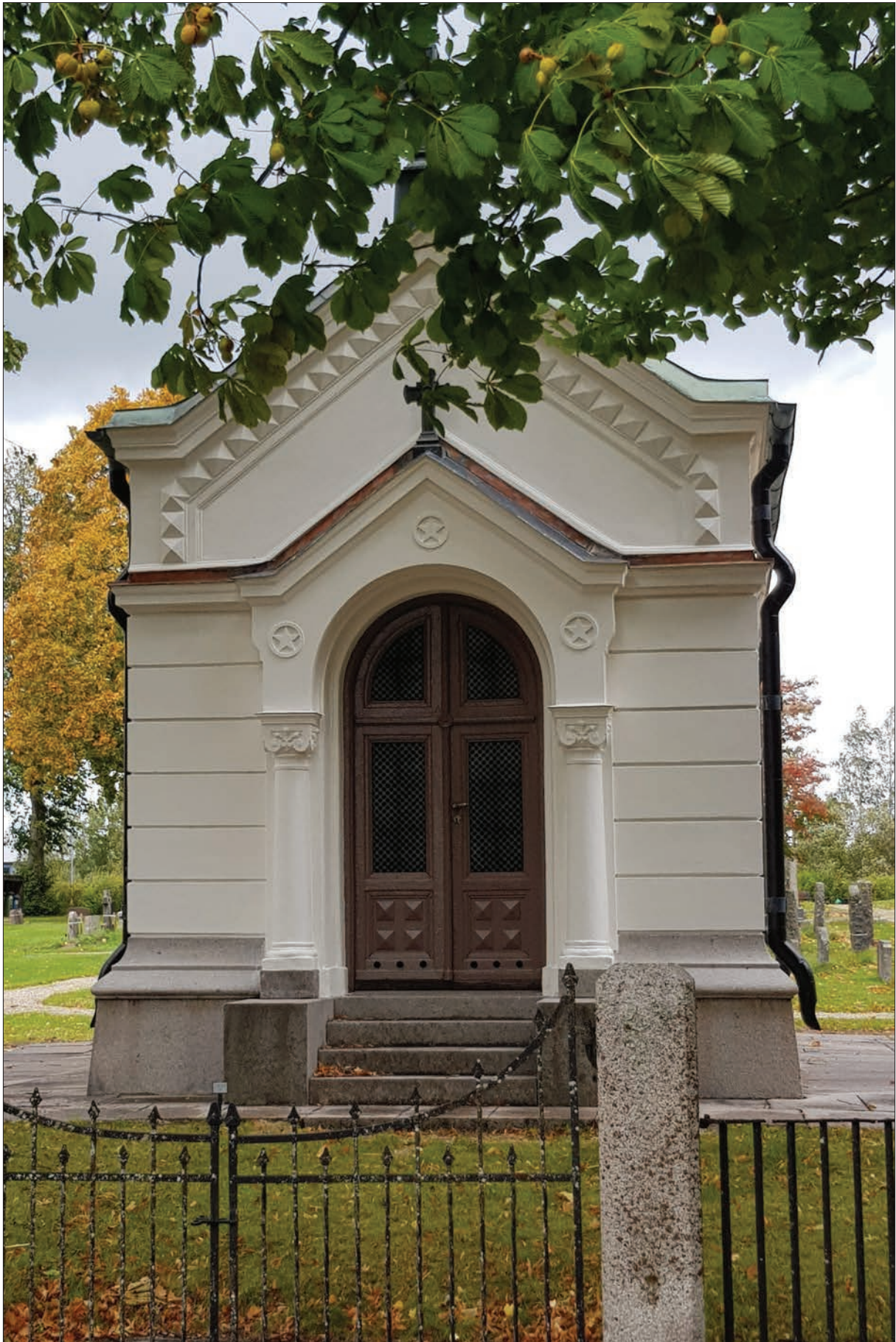
Figur 21. Ohlssons gravkor, södra fasaden.