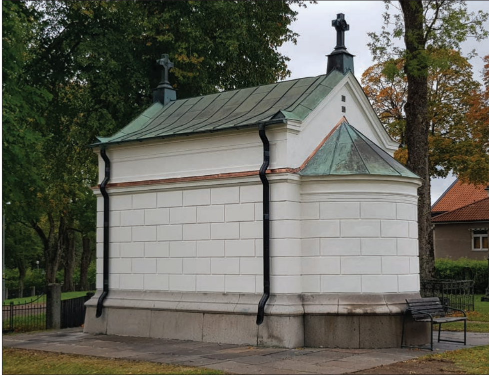
Figur 14. Ohlssons gravkor vid ansynning den 26 september 2018. Östra och norra fasaden.