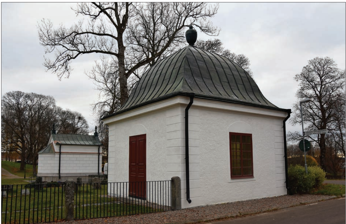
Figur 26. Hisings-Heikenskiölds gravkor, norra och västra fasaden.