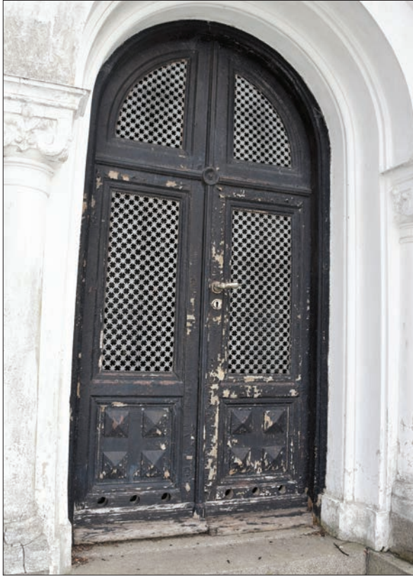
Figur 4. Entréddörr till Ohlssons gravkor. Dörrarna var målade i svart kulör.