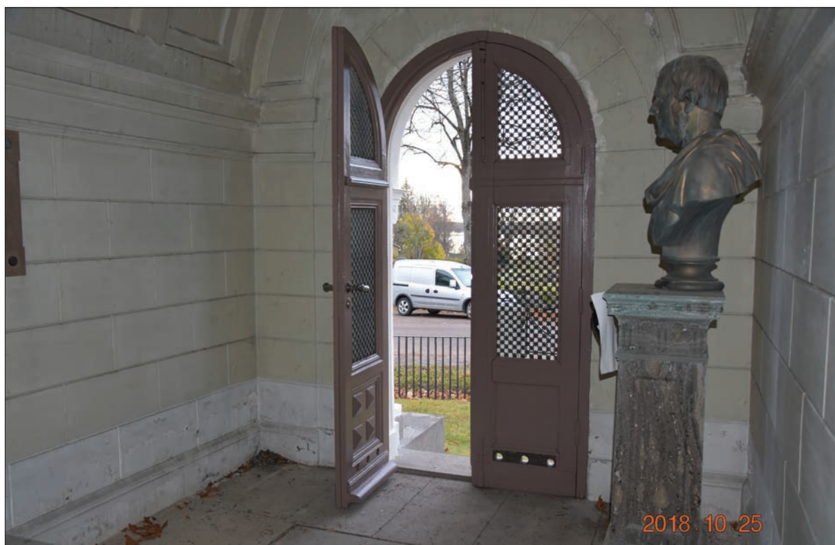
Figur 33. Interiören, Ohlssons gravkor.