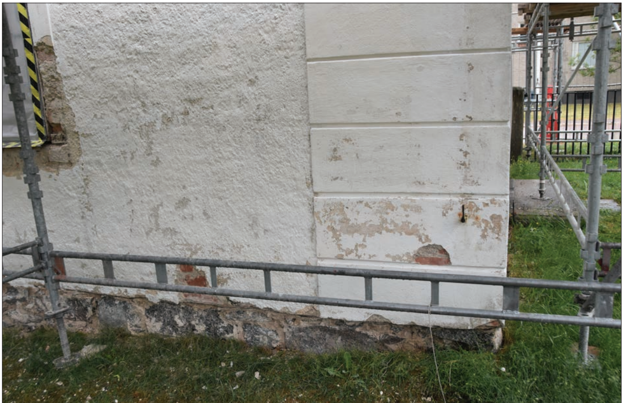
Figur 13. På Hisings-Heikenskiölds gravkor har man funnit gul kulör, vilket möjligen kan vara den ursprungliga kulören med järnvitriol. Detalj av slätputsade hörnkedjor, östra fasaden.