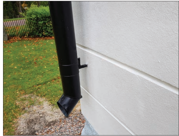
Figur 23. Detalj av stuprör, Hisings-Heikenskiölds gravkor.