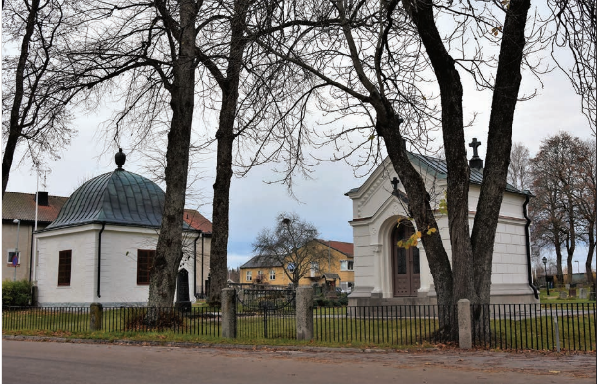
Figur 19. De nyrenoverade gravkoren sedda från vägen.