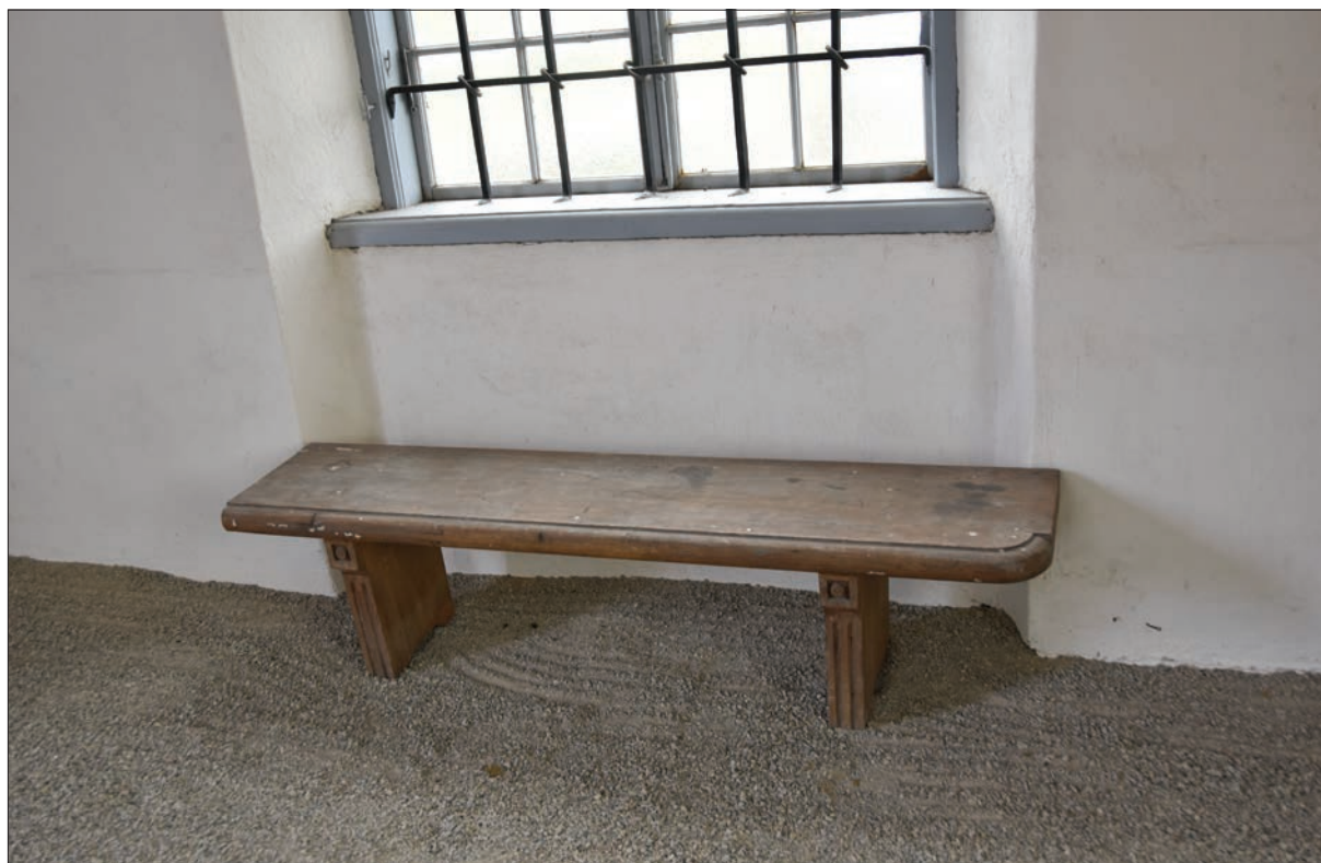
Figur 36. Detalj av grus och träbänk vid ett av fönstren, Hisings-Heikenskiölds gravkor.