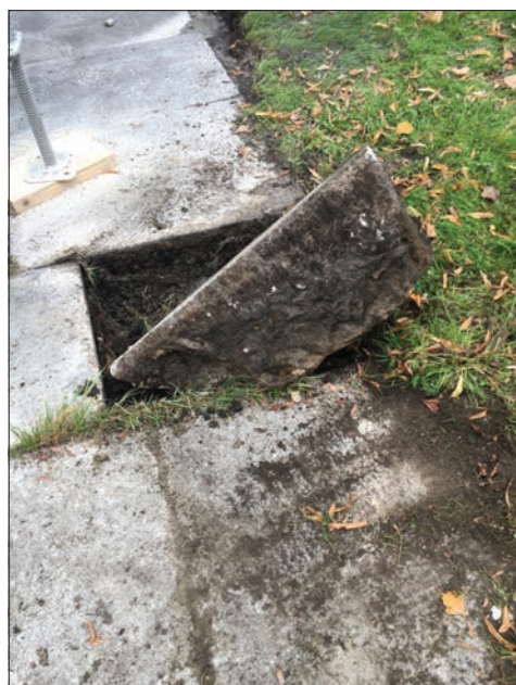
Figur 17. Detalj av de grovhuggna stenhällarna, vid Ohlssons gravkor.