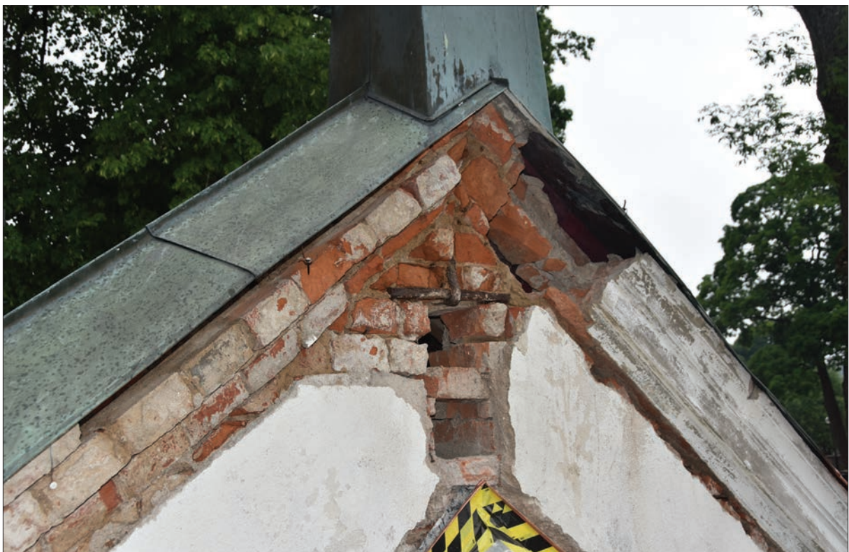
Figur 9. Detalj av murvek närmast takfot som ersattes med stortegel av samma format. Norra fasaden, Ohlssons gravkor.