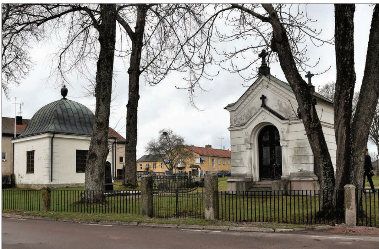
Figur 3. Gravkoren sedda från söder. Hisings-Heikenskiölds gravkor till vänster i bild.