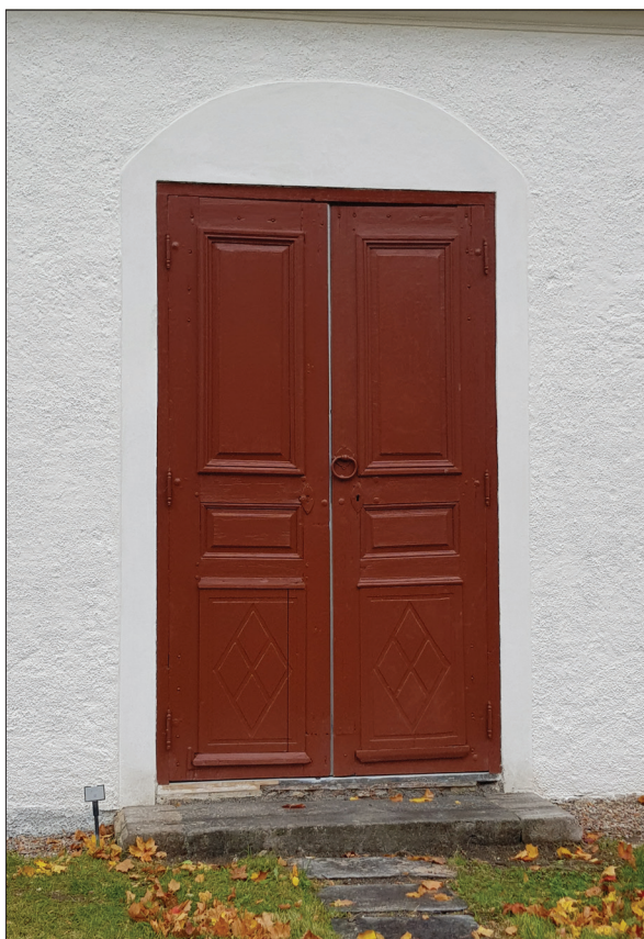
Figur 28. Nymålade entrédörr, Hisings-Heikenskiölds gravkor.