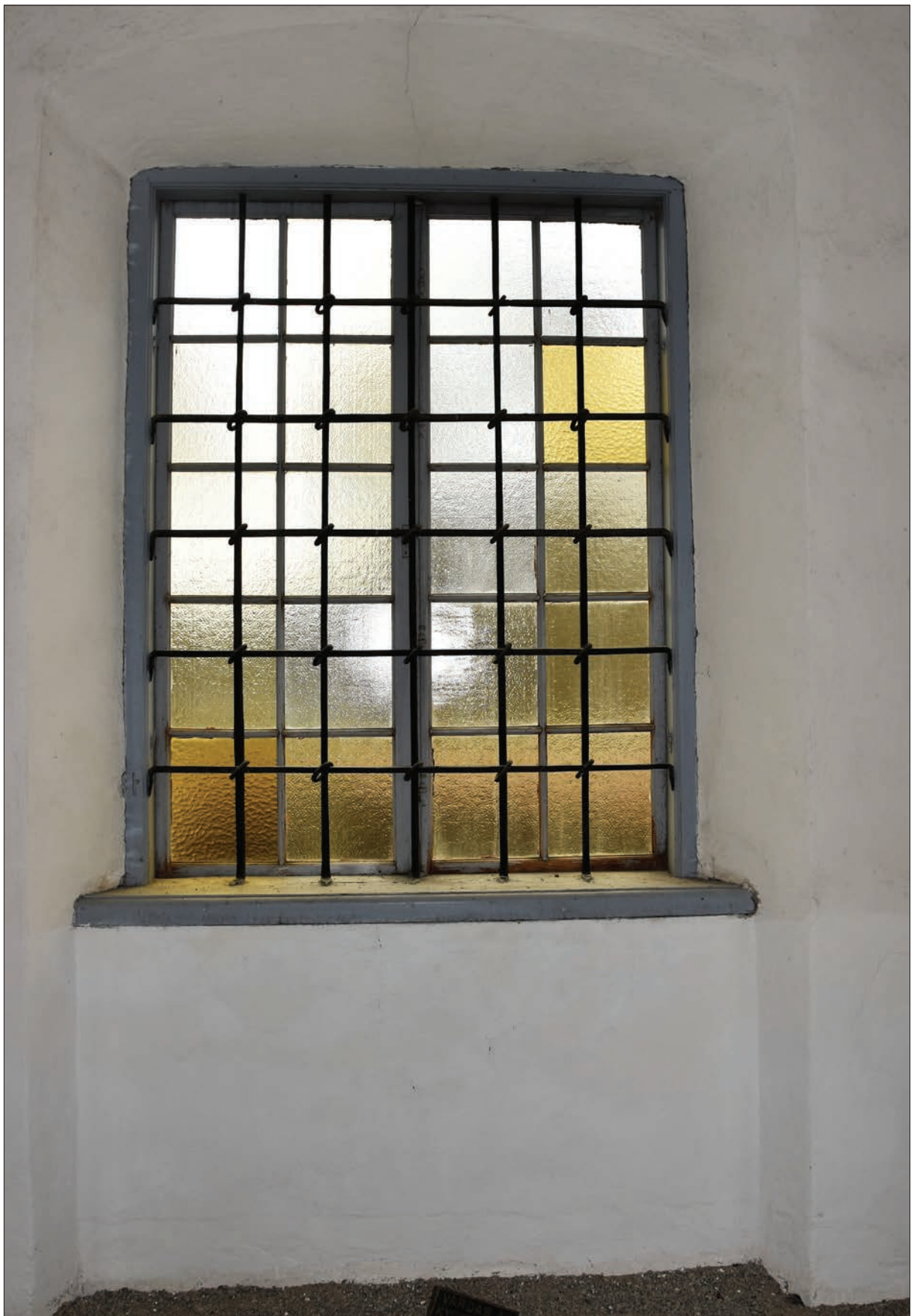
Figur 38. Fönster med galler sett från insidan, Hisings-Heikenskölds gravkor. Bilden är tagen före renoveringen.