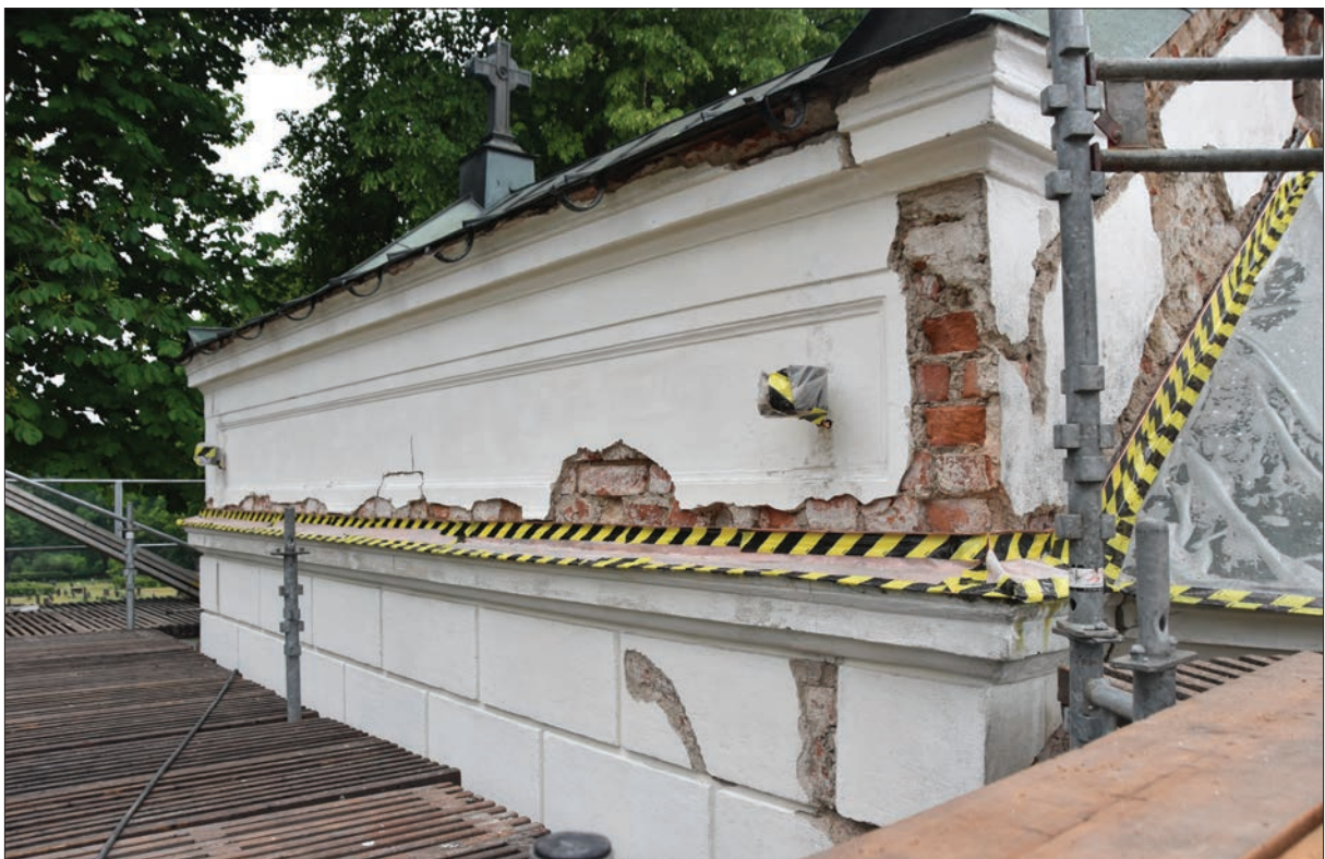
Figur 11. Detalj av östra fasaden, Ohlssons gravkor.