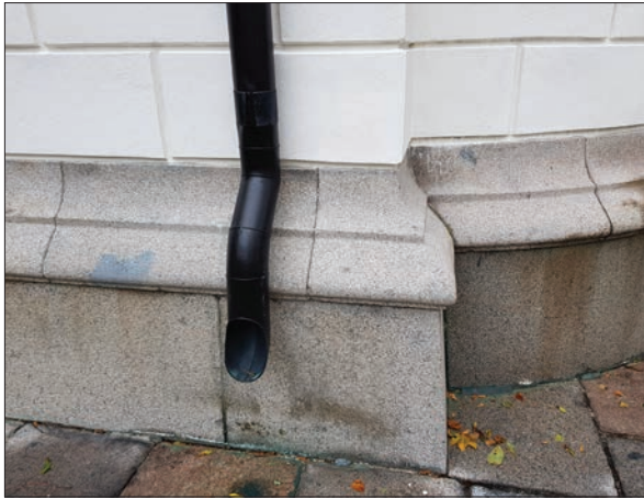
Figur 22. Detalj av stuprör, Ohlssons gravkor.