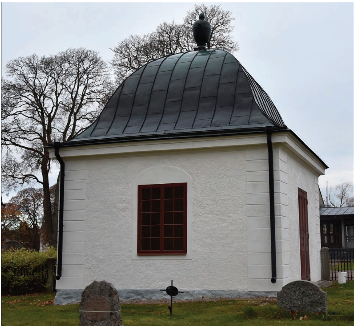
Figur 24. Hisings-Heikenskiölds gravkor vid besiktning i oktober 2018.