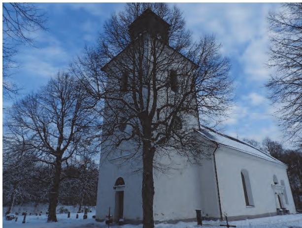
Figur 9. Träden sedda från sydväst före fällning.