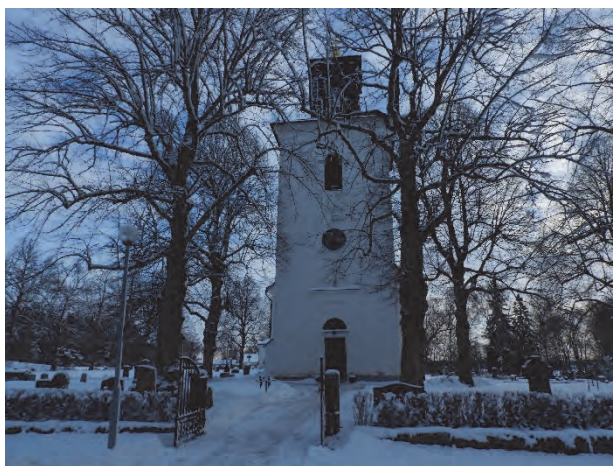
Figur 11. Kyrkan sedd från väster före fällning.