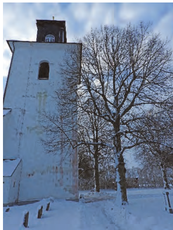
Figur 6. Träden sedda från norr före fällning. I synnerhet i detta läge har man haft fuktproblem i tornfasaden.

Man har fällt de båda lindarna. Arbetet utfördes av kyrkogårdsförvaltningen i egen regi. Båda träden togs ned i delar för att inte riskera att skada kyrkans fasad eller gravvårdar på kyrkogården. Arbetet utfördes från skylift. Efter fällningen har man fräst ned stubbarna en bit under mark. Stora delar av rotsystemet fick dock vara kvar under jord. Arbetet fortlöpte helt enligt planerna.