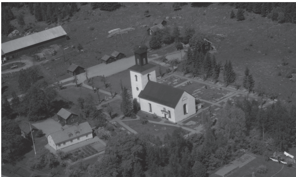
Figur 4. Flygfoto över kyrkogården 1965 med kraftigt beskurna träd. (fotografiet beskuret).