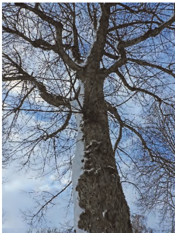
Figur 8. Södra trädet före fällning. Spår av tidigare beskärning.