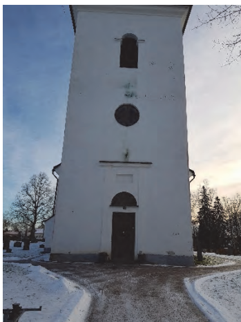
Figur 12. Kyrkan sedd från väster efter det att träden fällt.