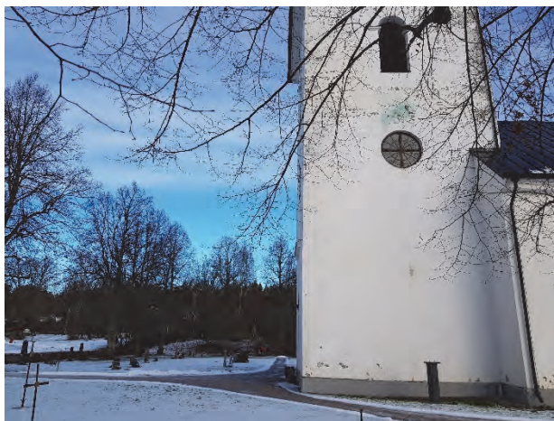
Figur 13. Kyrkan sedd från söder efter det att träden fällt.