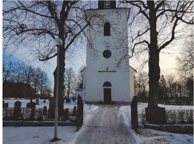
Figur 15. Kyrkan sedd från väster efter det att träden fällts.