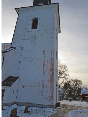
Figur 14. Kyrkan sedd från norr efter det att träden fällts. Rödalgerna framträder tydligt på tornfasaden.