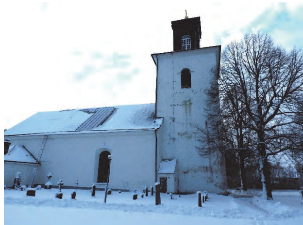
Figur 7. Träden sedda från norr före fällning.