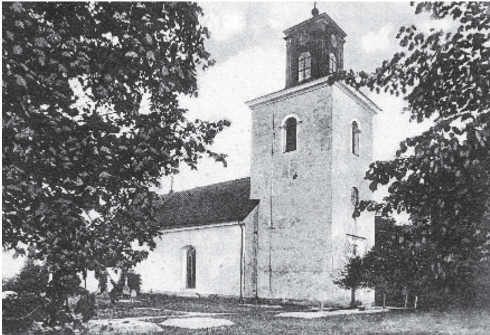
Figur 3. Kyrkan sedd från nordväst omkring sekelskiftet 1900. Okänt år och fotograf.