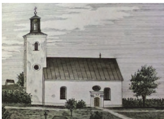
Figur 2. Avbildning av kyrkan av Eric Ihrfors, 1890-talet.

De fuktproblem man sett som en följd av träden syns tydligast på tornets norra fasad, där bland annat ett stort parti av rödalger är påtagligt. De röda algerna blir allt oftare synliga på putsade fasader. 3 De trivs på fuktiga partier och ofta visar de sig på de ställen på fasaden där vindens undertryck ger en ökad fukthalt. De trivs bäst på KC- och cementputs och inte så bra på kalkavfärgad kalkputs som har ett något högre pH än cementputs.