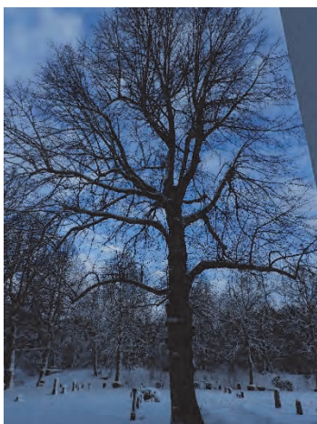
Figur 10. Norra trädet före fällning.