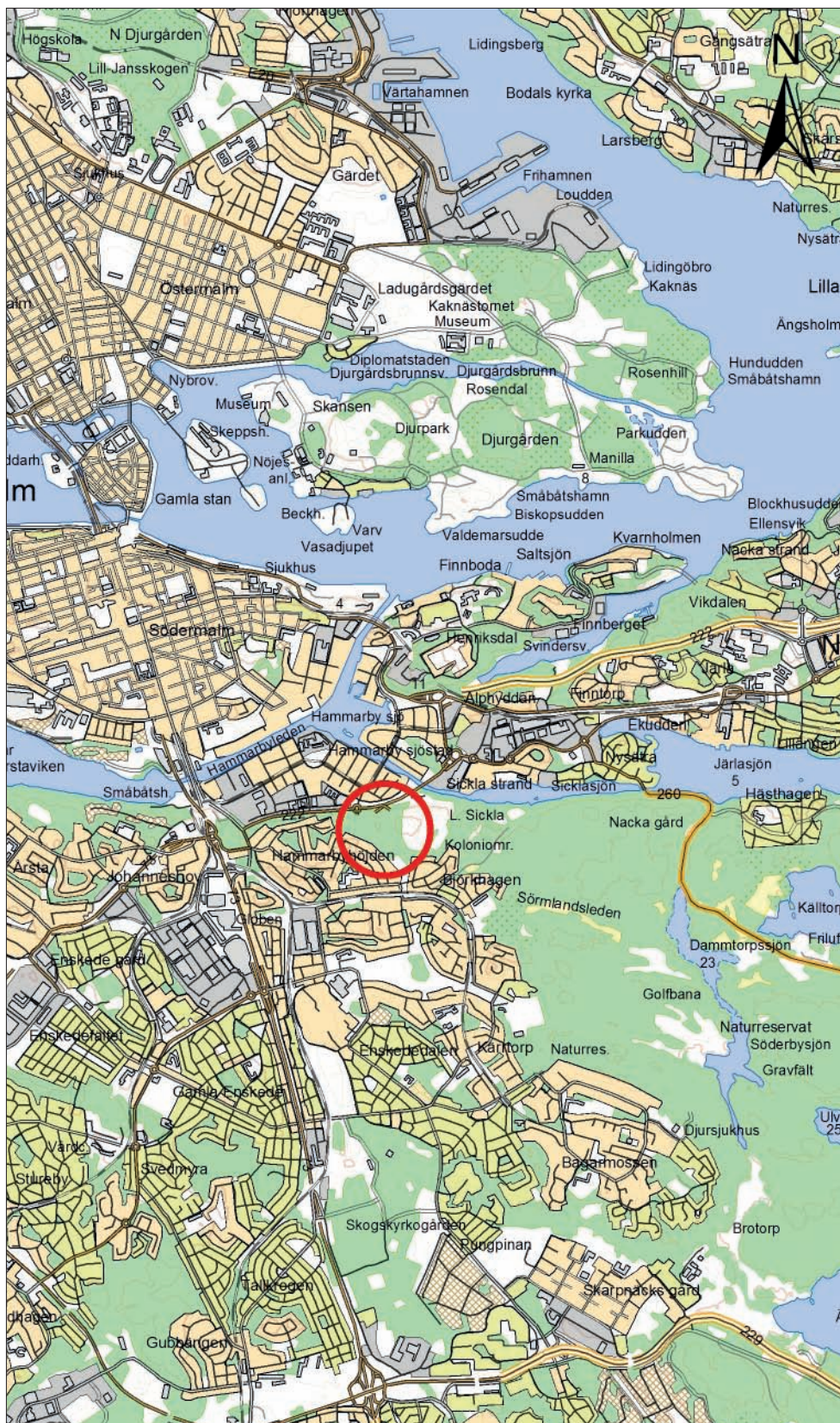
Figur 1. Utredningsområdet markerat med en röd ring. Utdrag ur Terrängkartan. Skala 1:50 000.