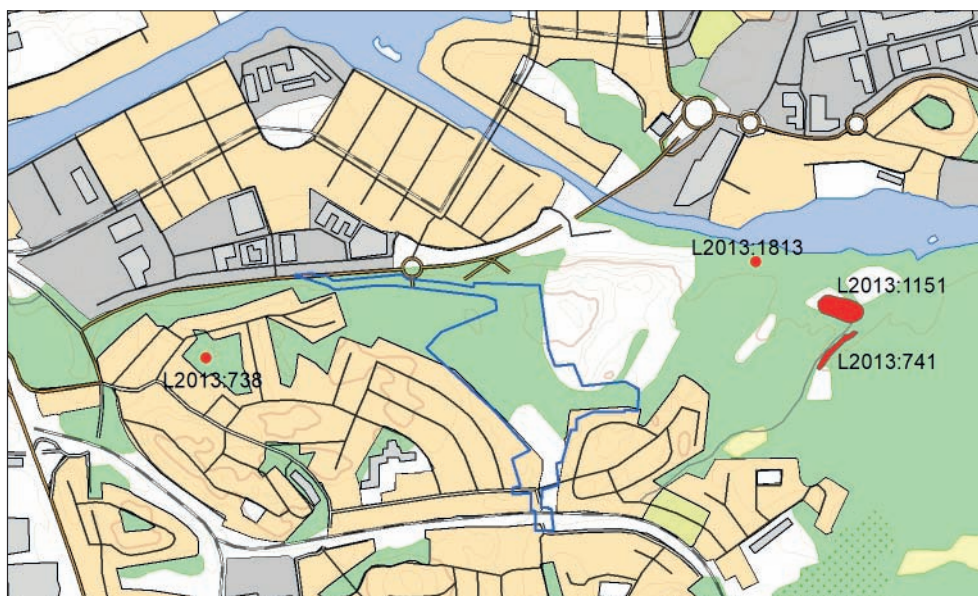
Figur 3. Översikt över de lämningar som nämns i texten. Utredningsområdet markerat i blått. Utdrag ur Terrängkartan. Skala 1:20 000.

Utredningsområdet är cirka 17 hektar stort och merparten av området ligger på mellan 35 och 45 meter över havet, men med vissa partier som når upp till 50 meter över havet. I den södra delen finns en idrottsplats och en anlagd lekplats. Åt öster angränsar området till den konstruerade Hammarby skidbacke och i övrigt dominerar gles blandskog. Flera anlagda gång- och cykelvägar löper över ytan. De icke exploaterade partierna består till övervägande del av bergig, stundtals blockig terräng med mindre områden av glacial lera och tunna, osammanhängande ytlager av morän. Det finns inga sedan tidigare kända fornlämningar inom området. Då området ligger så högt bedömdes det finnas möjligheter att lämningar från stenåldern och framåt skulle kunna påträffas. Strax väster och öster om utredningsområdet ligger två kulturhistoriskt intressanta platser – dels galbacken L2013:738, dels gården Lilla Sickla L2013:1151 med sin engelska park och L2013:741, en dammanläggning för en kvarn tillhörande gården. Direkt öster om skidbacken finns även L2013:1813 vilken utgör en lägenhetsbebyggelse (torpgrund) (figur 3).