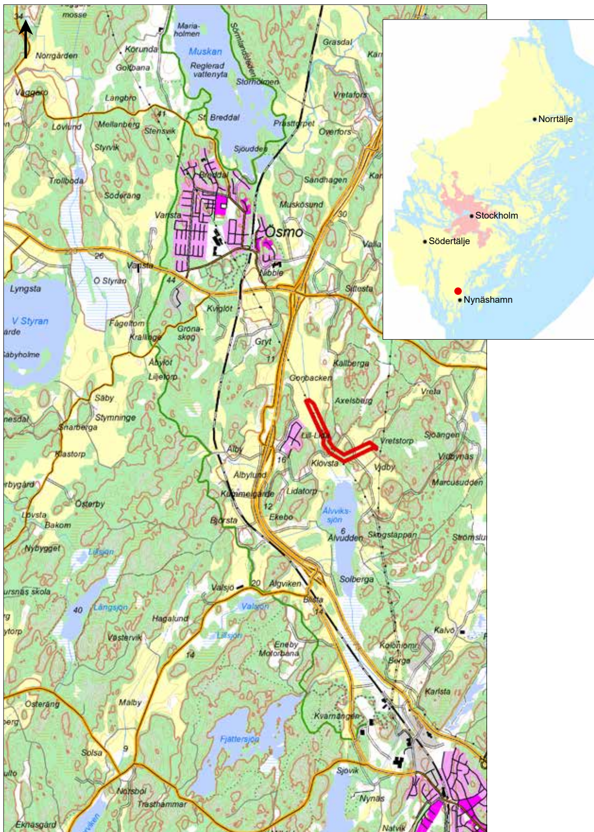
Figur 1. Utredningsområdet markerat med röda linjer. Utdrag ur Terrängkartan. Skala 1:50 000.