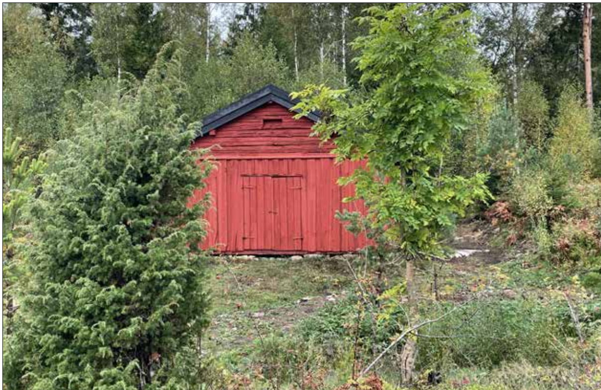
Figur 34. Slutbesiktning den 24 september 2021.