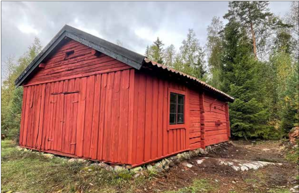
Figur 36. Södra gaveln och östra långsidan.