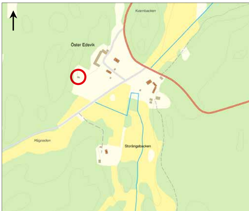
Figur 2. Kartan visar gårdsanläggningen. Röd cirkel anger linbastans placering en bit ifrån gården. Utdrag ur Länsstyrelsens WebbGis.