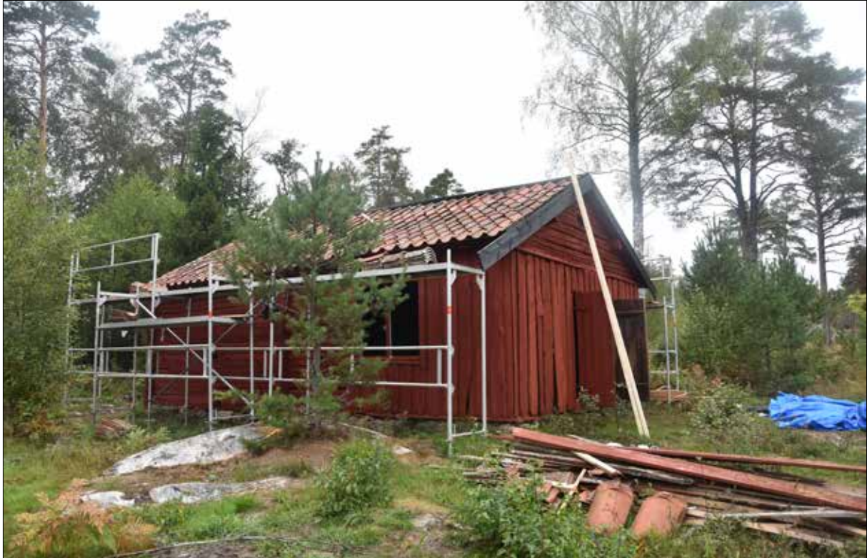
Figur 24. Byggmöte den 10 september. Nockpannor är ännu inte på plats. Vattenlisten på södra gaveln är ännu inte utbytt och lösa brädor ännu inte fastspikade. Bastan saknar också fönster. Västra och södra fasaden.