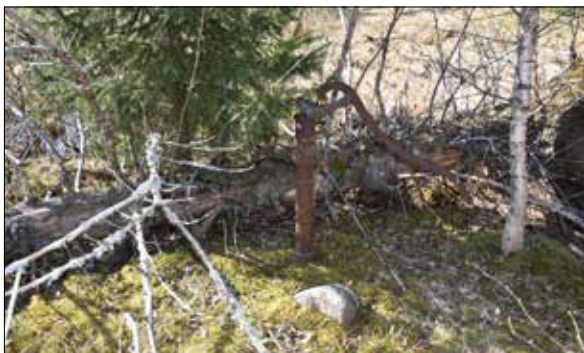
Figur 12. Inte långt från bastan finns en vattenpump. Lena minns pumpen från när hon var barn och efter lite letande hittade vi den.