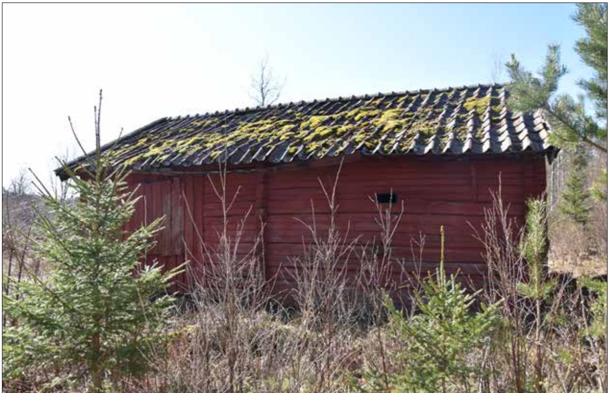
Figur 6. Östra sidan före renovering.