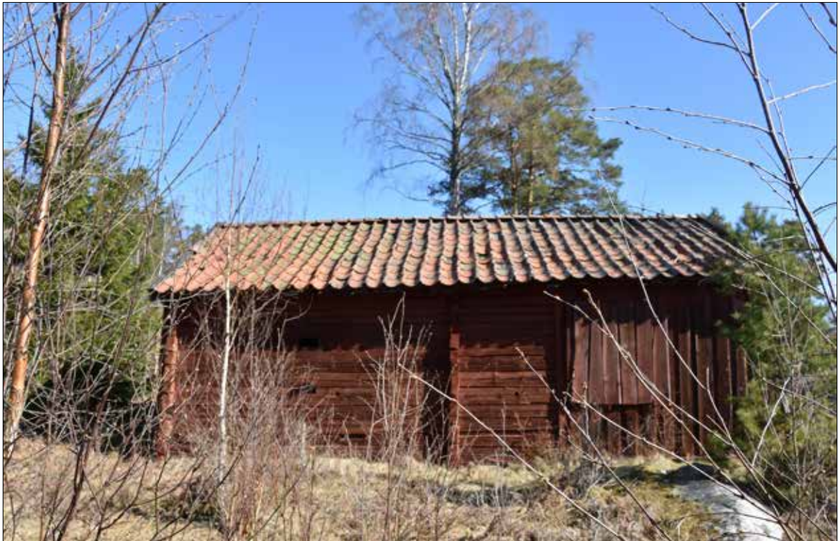
Figur 5. Västra sidan före renovering.