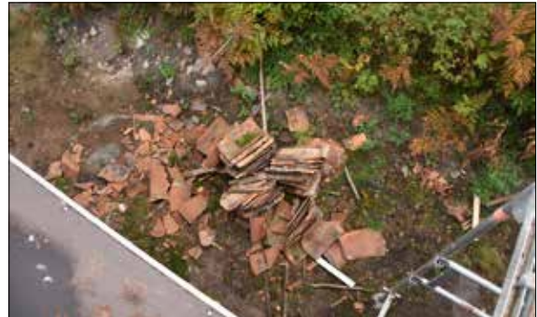
Figur 29. Några takpannor gick inte att rädda.