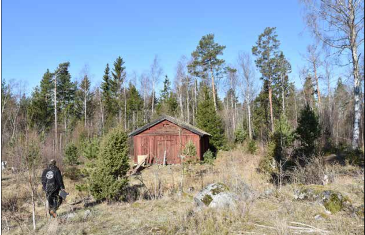
Figur 3. Linbastan som den såg ut före renovering. Tobias från TL Kvalitet AB ses på väg till linbastan som ligger på lämpligt avstånd från gården.