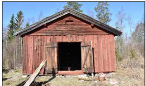
Figur 13. Södra gaveln före renovering. Lagg märke till den snedställda vattenlisten som behöver bytas.