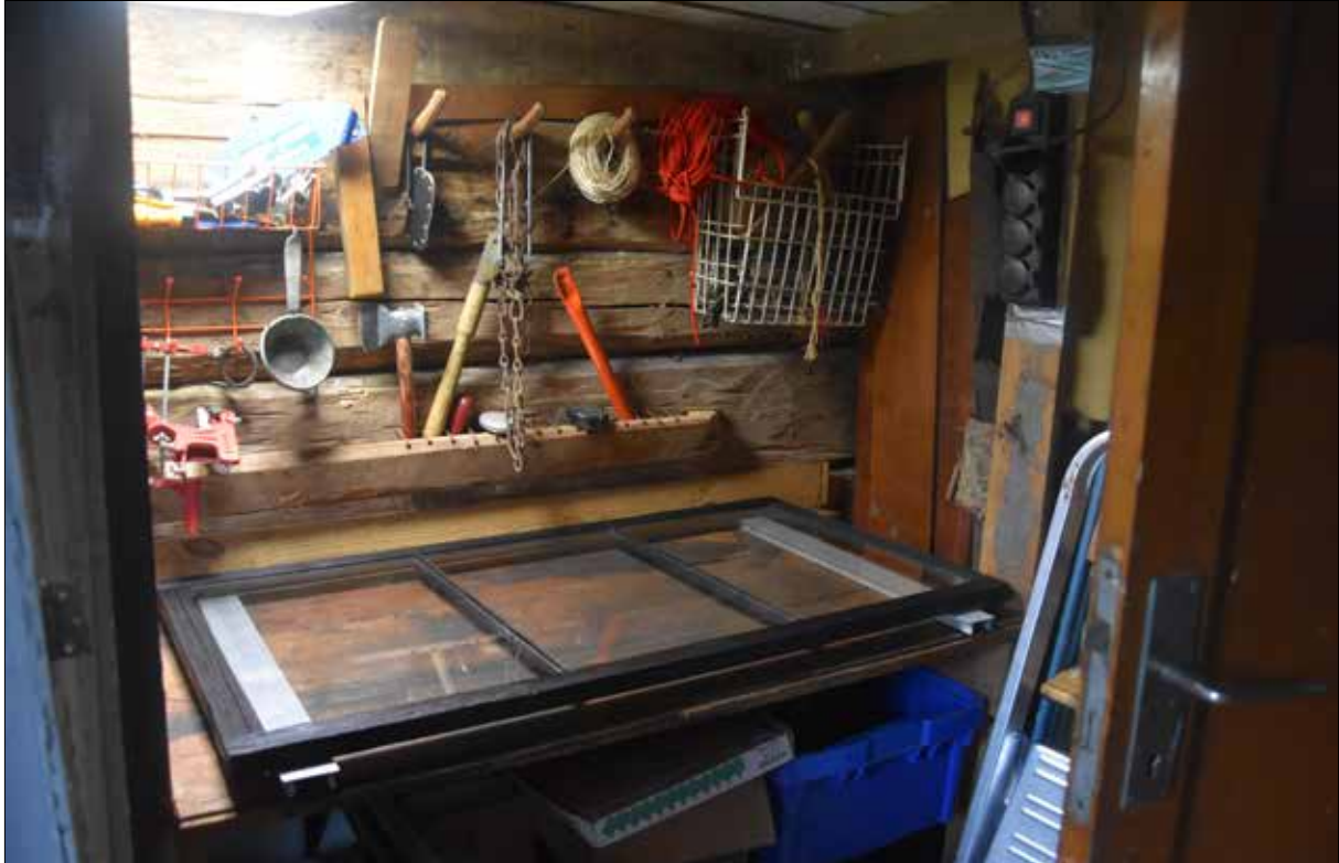
Figur 21. Fönster på tork i ladan.