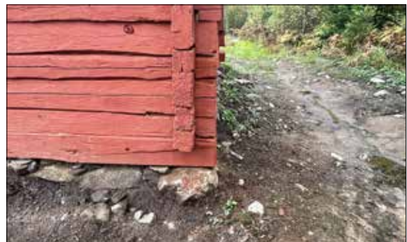
Figur 33. Syllen, östra hörnet. Lagad och målad.