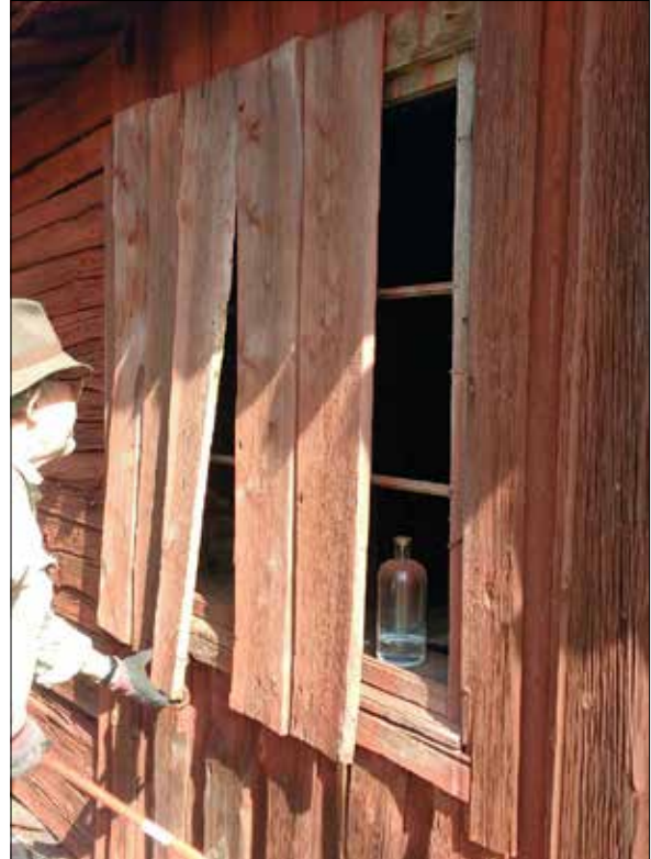
Figur 9. Under brädorna på västra fasaden döljer sig ett fönster utan glas.