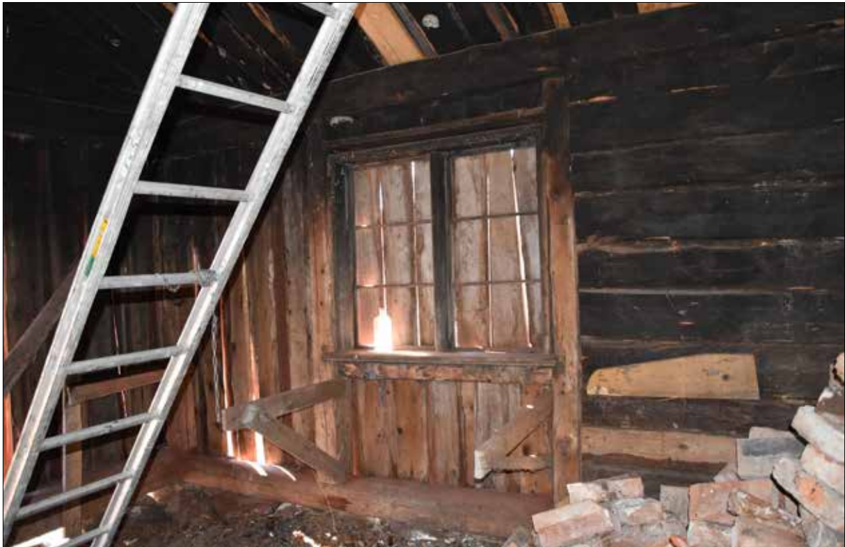
Figur 14. Ett av de överspikade fönstren sedd från insidan i april 2021.