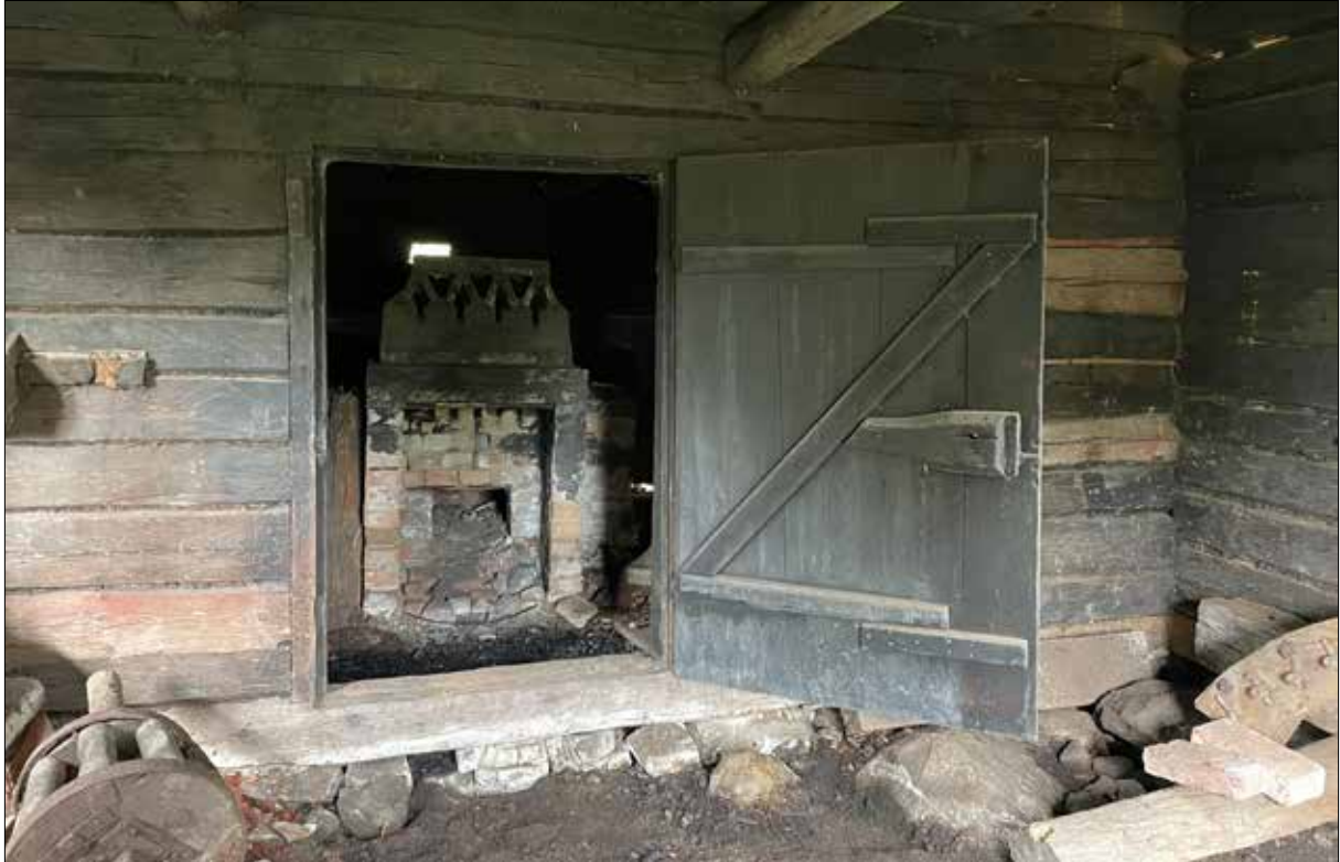
Figur 38. Kikar in i bastan.