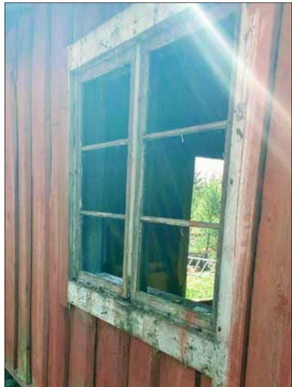
Figur 16. Detalj av fönster före renovering, östra sidan.