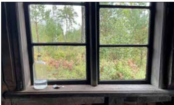
Figur 40. Detalj av fönstret, utsikt mot öster.