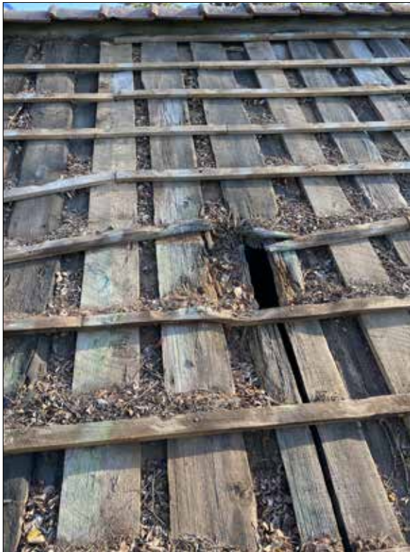
Figur 19. Hål i östra takfallet.