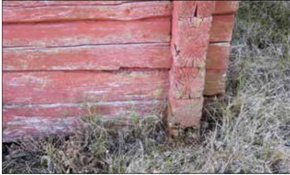
Figur 7. Rötskadad syll, östra hörnet.