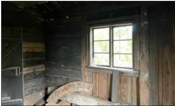
Figur 39. Fönstret åter på plats. Lagad och målat.