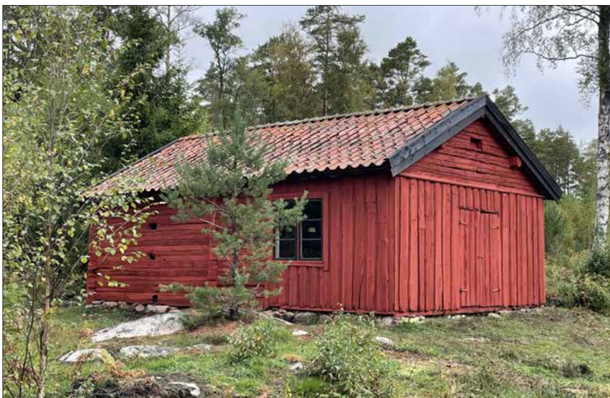
Figur 35. Södra gaveln och östra långsidan. Marken är dränerad, taket omlagt och fasaden målad med röd slamfärg. Lägg också märke till hur fint det blev med fönstret.