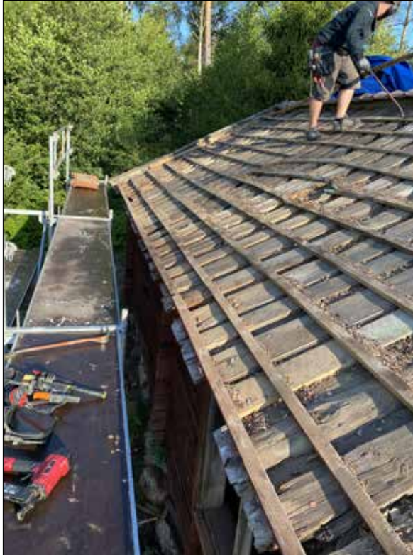
Figur 17. Takpannor är nedblockade, 6 augusti 2021.