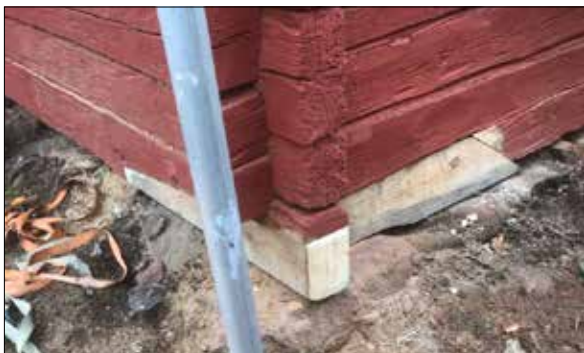
Figur 32. Ilagning av syll, nordöstra hörnet.