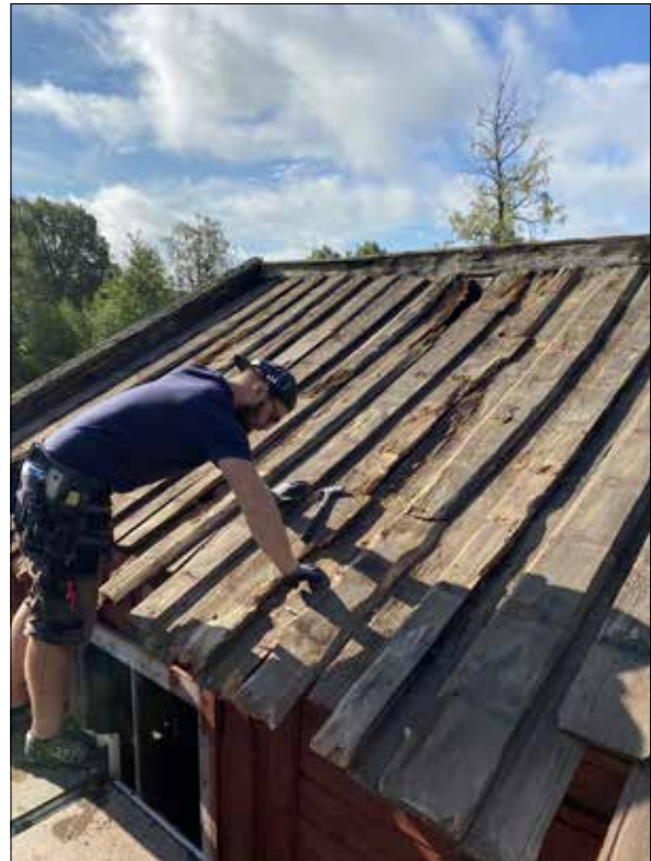
Figur 20. Niklas i arbete, östra takfallet.