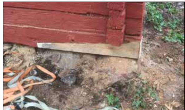
Figur 31. Syllen, östra hörnet.