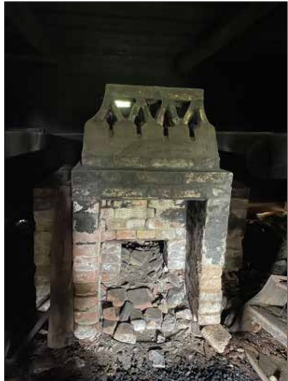
Figur 41. Ugnen i bastan. Till höger skymtar trappsteg till bastulaven.