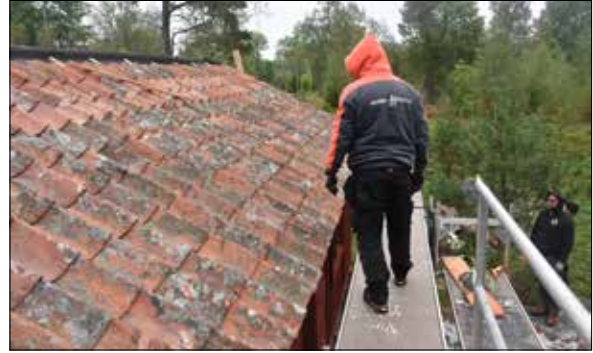
Figur 27. Utsikt mot söder, västra takfallet.