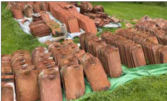
Figur 30. Gårdens lertegel.