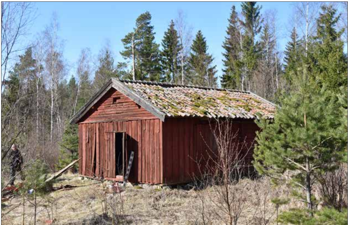
Figur 4. Södra gaveln och östra fasaden före renovering vid startmötet i april 2021. Lägg märke till all mossa som tynger taket och det överspikade fönstret.