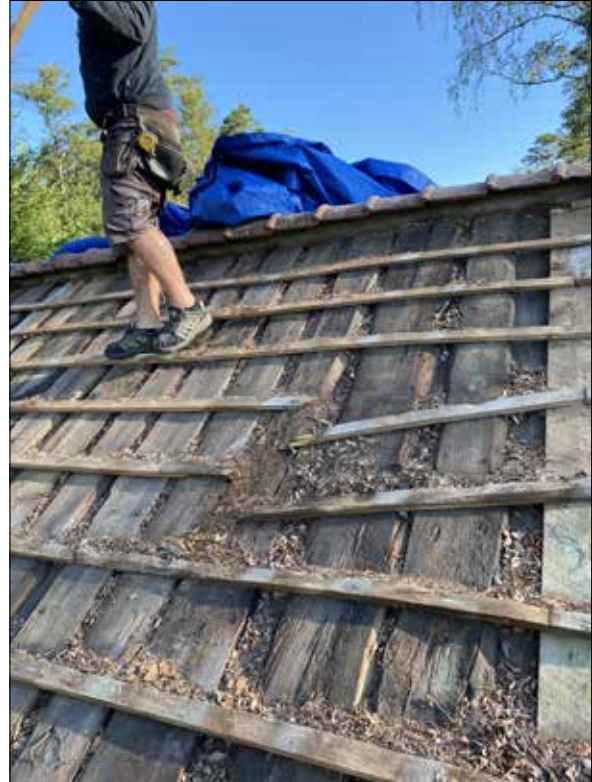
Figur 18. Detalj av trasig läkt.