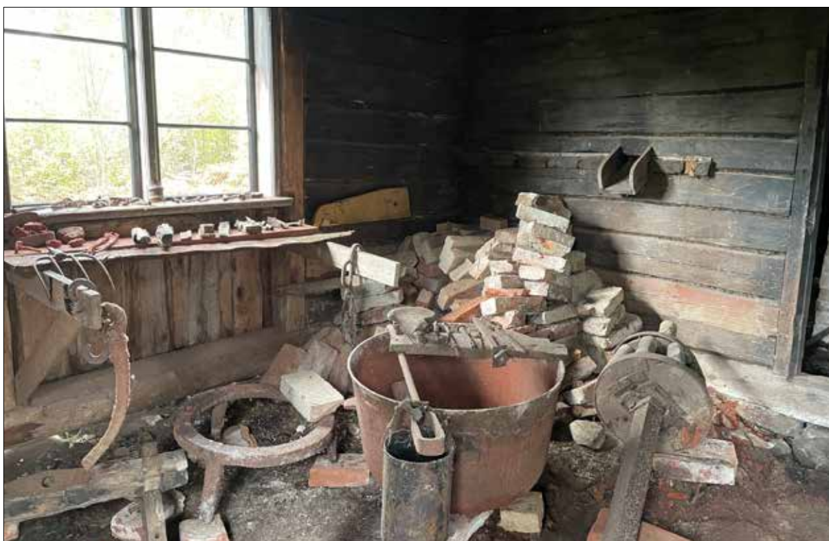
Figur 43. Linbastan är renoverad och städad, och det finns kunskap om föremålen som användes vid linberedningen.