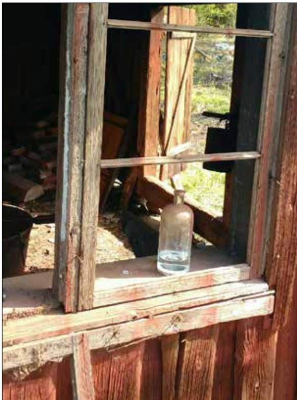
Figur 15. Detalj av fönster sett från utsidan, efter att brädorna plockats bort..