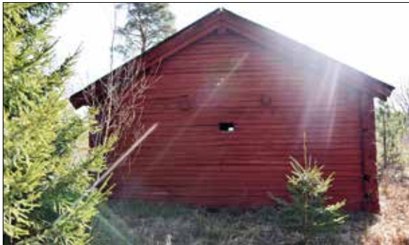
Figur 10. Norra gaveln före renovering.