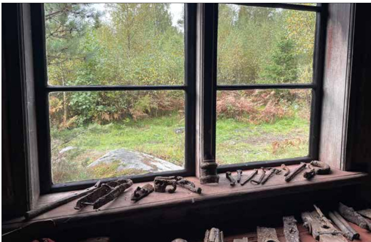
Figur 42. Utsikt mot väster. Lena har inrett ett litet museum i den färdigrenoverade linbastans förstuga.