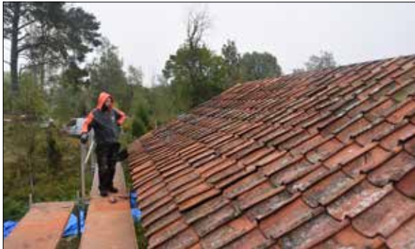
Figur 28. Östra takfallet. Christian visar stolt upp taket på byggmöte i september 2021.