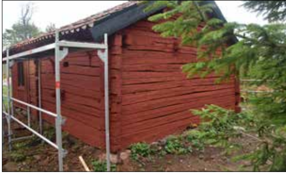
Figur 26. Byggmöte i början av september. Norra gaveln.