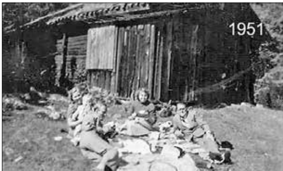
Figur 8. Picknick vid linbastan 1951.